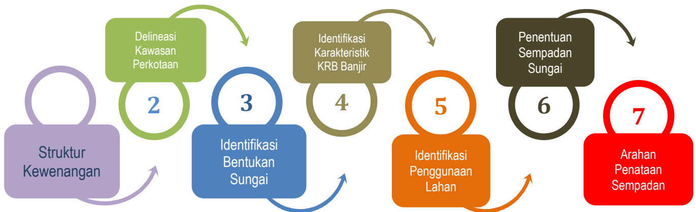
Gambar 1. Kerangka Kerja/Literatur