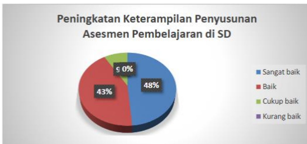
Gambar 4. Hasil angket pengetahuan asesmen pembelajaran di SD tetapi belum mampu dalam menyusun asesmen pembelajaran di SD

Indikator peningkatan keterampilan penyusunan asesmen pembelajaran di SD, sebanyak 17 responden yang menjawab sangat baik, 15 responden yang menjawab baik, 3 responden yang menjawab cukup baik serta tidak ada responden yang menjawab kurang baik. Berikut disajikan dalam diagram perolehan hasil respon indikator pengetahuan tentang asesmen pembelajaran di SD tetapi belum mampu dalam menyusun asesmen pembelajaran di SD.