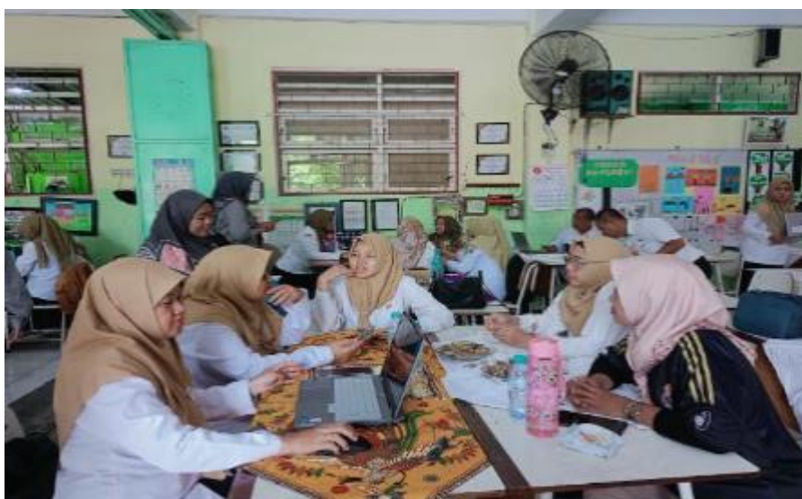
Gambar 6. Sesi tanya jawab dan diskusi kelompok

Rangkaian akhir kegiatan berupa diskusi dan kolaborasi dalam kegiatan ini ditunjukkan melalui sesi tanya jawab dalam dan antar kelompok yang dapat ditunjukkan melalui gambar 6 berikut ini.