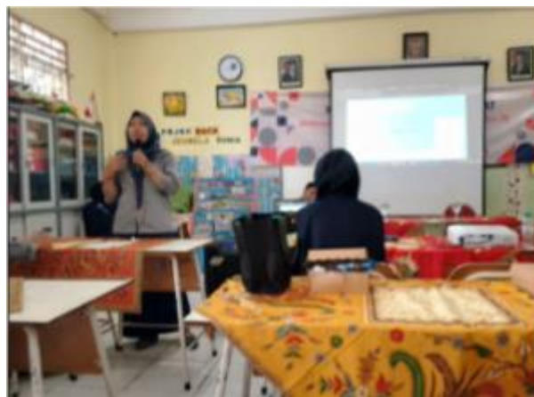
Gambar 1. Narasumber memaparkan materi

Kegiatan ini telah dilaksanakan oleh TIM Pengabdian Masyarakat Prodi PGSD, Fakultas Ilmu Pendidikan, Universitas PGRI Adi Buana Surabaya Bersama dengan tim guru SDN Dukuh Menanggal I Surabaya, Kegiatan ini dihadiri oleh 35 orang dan dilaksanakan di Aula SDN Rungkut Menanggal I Surabaya. Kegiatan pengabdian masyarakat ini dilaksanakan pada semester ganjil 2024-2025 tepatnya tanggal 13 November 2024 dan bertujuan untuk meningkatkan kompetensi guru SDN Dukuh Menanggal I Surabaya tentang pendekatan penilaian khususnya assesment as learning beserta perancangannya. Berikut dokumentasi pelaksanaan kegiatan.