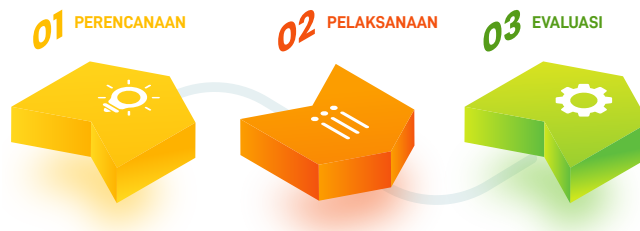
Gambar 1. Tahapan pelaksanaan

Metode pelaksanaan dalam pengabdian kepada masyarakat yang berjudul pelatihan deep learning bagi guru SLB: langkah menuju pendidikan berbasis teknologi asistif dan pembelajaran adaptif menggunakan langkah-langkah sebagai berikut: perencanaan (koordinasi penjadwalan dan penyusunan materi), pelaksanaan (pre-test dan pelatihan) dan evaluasi (post-test dan FGD). Peserta pada pelatihan ini berjumlah 20 guru dari SLB Mutiara Hati Sidoarjo.