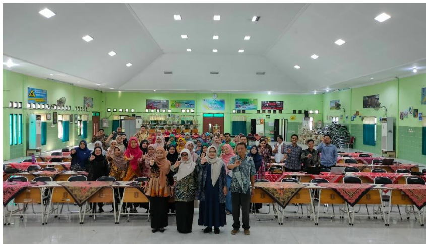
Gambar 4.1. Dokumentasi kegiatan PPM