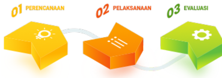
Gambar 1. Tahapan pelaksanaan

Metode pelaksanaan dalam pengabdian kepada masyarakat menggunakan langkah-langkah sebagai berikut: perencanaan (koordinasi penjadwalan dan penyusunan materi), pelaksanaan (pre-test dan pelatihan) dan evaluasi (post-test dan FGD). Peserta pada pelatihan ini berjumlah 15 guru di Surabaya.