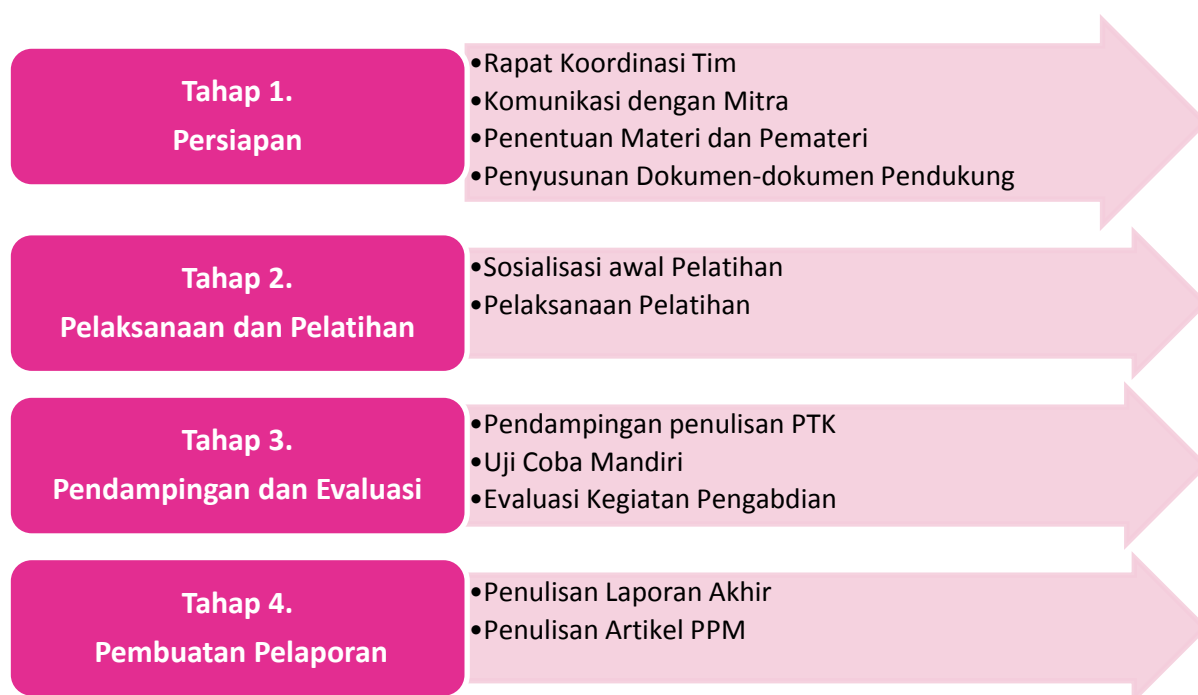
Gambar 1. Tahapan Pelaksanaan Kegiatan Pengabdian kepada Masyarakat

Pelaksanaan kegiatan pengabdian kepada masyarakat ini dilakukan oleh tim dosen dan mahasiswa jurusan Pendidikan Bahasa Indonesia, FISH Universitas PGRI Adi Buana Surabaya pada tanggal 24 Agustus 2020 secara virtual/daring. Hal ini dilaksanakan karena kondisi masih pandemi dan tidak memungkinkan untuk tatap muka secara langsung. Metode yang digunakan adalah dengan melakukan sosialisasi, pelatihan, dan pendampingan bagi guru UPT SMP N 10 Gresik Jawa Timur. Tahapan pelaksanaan kegiatan pengabdian kepada masyarakat dapat dilihat pada Gambar 1.