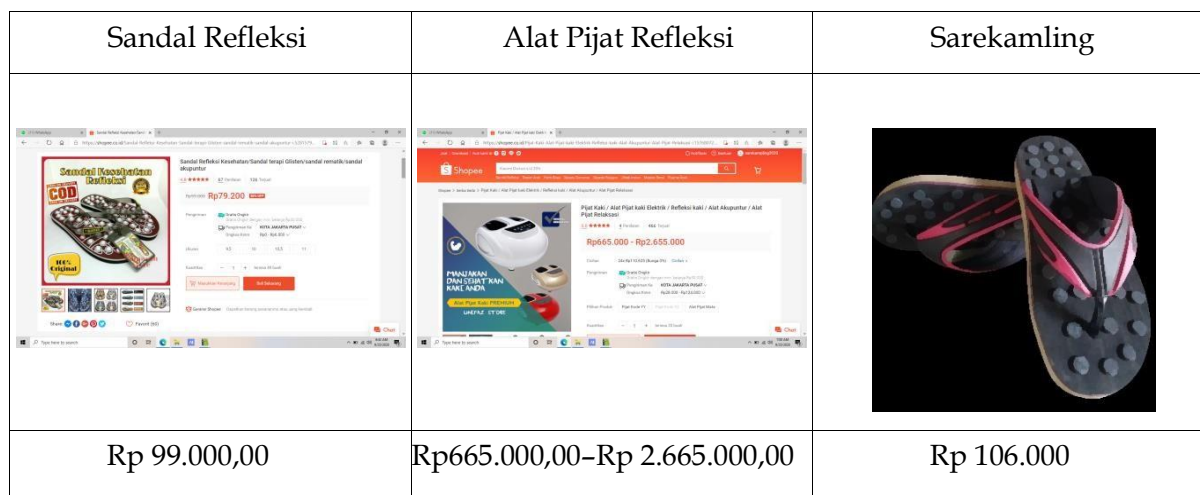
Tabel 1. Kompetitor