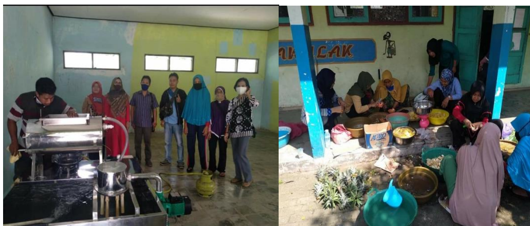
Gambar 2. Proses Pembuatan kripik buah

Pelatihan dalam pengembangan produk dan desain kemasan dilaksanakan pada tanggal 24 Juli 2021. Berdasarkan pertimbangan kondisi pandemi covid 19 dan masih dalam masa PPKM darurat maka pelatihan dan pendampingan dilaksanakan secara on line. Dalam kegiatan pelatihan ini mitra diberikan pelatihan bagaimana cara memilih bahan baku yang baik untuk dijadikan kripik buah. Selain itu mitra juga diberikan informasi beberapa petani buah yang bisa dijadikan mitra dalam penyediaan bahan baku dengan harga yang relative lebih murah. Sehingga bisa menekan biaya produksi.