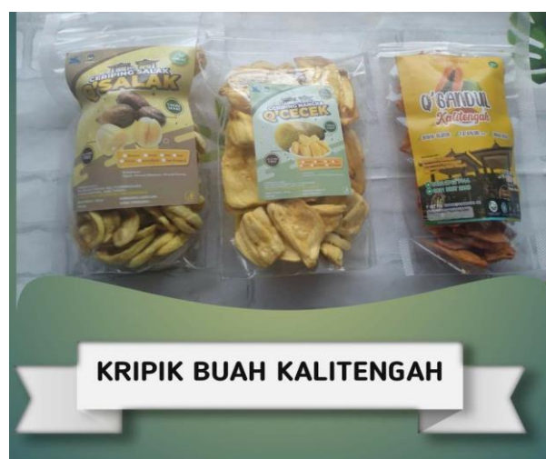
Gambar 3. Kemasan Produk kripik buah dari desa Kalitengah

Pelatihan dan pendampingan dalam pengemasan produk ini dilakukan dengan tujuan supaya mitra juga mengetahui ciri-ciri kemasan yang baik. Jenis kemasan yang digunakan adalah menggunakan plastic bening supaya produk kripik buah bisa terlihat sehingga lebih menggugah selera pembeli, karena produk kripik buah dari desa kalitengah merupakan kripik buah dengan kualitas yang baik karena diolah menggunakan mesin pembuat kripik buah ( vakum Fraying ).