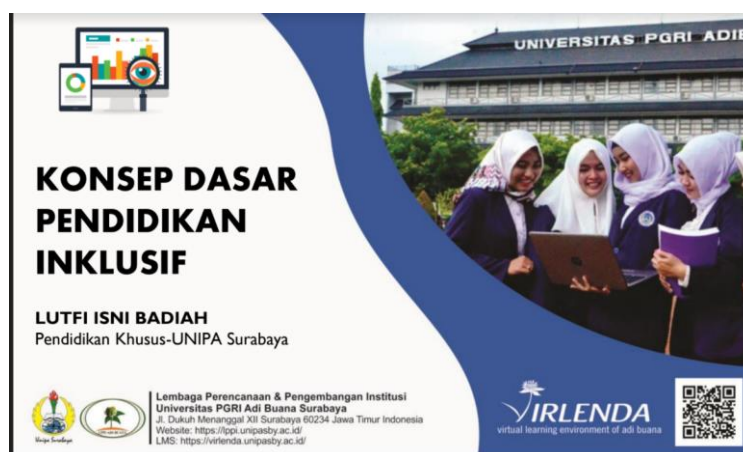
Gambar 1. Materi Pelatihan

Pada tahap ini dilakukan koordinasi dengan mitra, dan pengembangan materi pelatihan. Adapun materi dapat diakses melalui LMS di Universitas PGRI Adi Buana Surabaya yakni https://virlenda.unipasby.ac.id/ . Peserta yang mendaftar diberi akun untuk bisa mengakses materi berupa PPT, video dan modul selama proses pelatihan dan pendampingan. Adapun gambaran materi pelatihan berupa PPT adalah sebagai berikut.