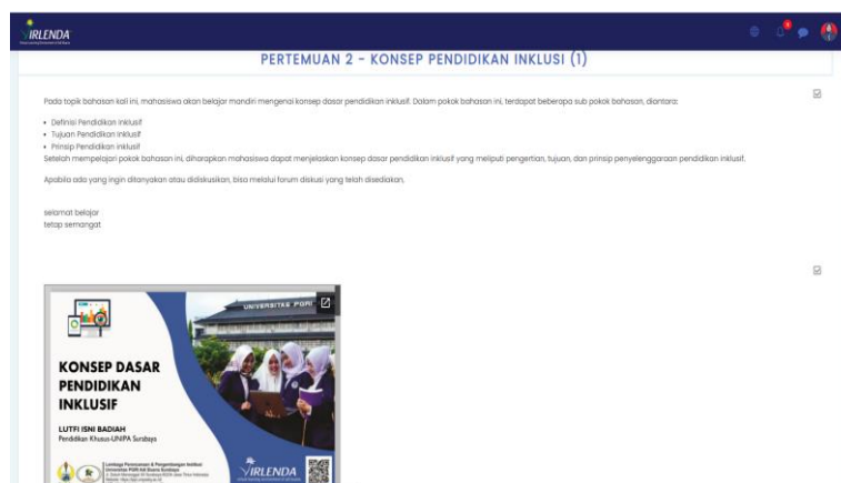
Gambar 2. Tampilan LMS