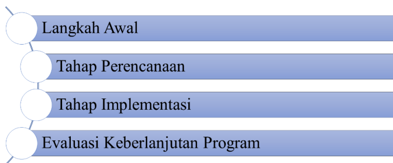
Gambar 1. Metode Pelaksanaan

Kegiatan pelatihan yang masuk dalam program Pengabdian Pada Masyarakat (PPM) ini dilaksanakan secara daring melalui webinar dengan tahapan seperti gambar 1.