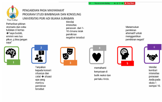
Gambar 2. Dokumen Kegiatan Implementasi Teknik Cognitive Restructuring

Peserta webinar sejumlah 158 peserta. Kehadiran peserta terdokumentasikan dalam gambar 3 berikut.