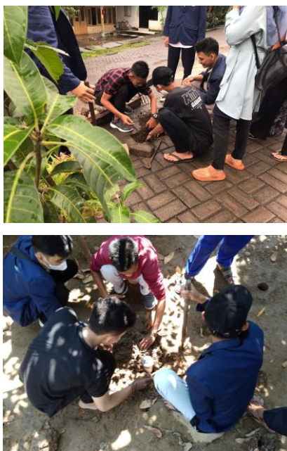
Gambar 3. Pemasangan Lubang Resapan Biopori

dan di Ruang terbuka hijau. Lubang Resapan Biopori yang ditanam sejumlah sepuluh buah dengan diameter 3 inchi dan panjang 40-80 cm. Pipa Lubang Resapan Biopori diisi juga dengan sampah kering, ranting pohon dan sisa makanan yang kemudian ditutup pipa yang telah dilubangi.