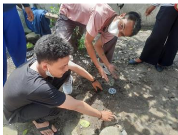
Gambar 4. Monitoring Lubang Resapan Biopori

dengan baik. Lubang Resapan Biopori dapat mengurangi genangan air di rumah warga pada saat musim hujan. Rumah masyarakat Desa Boboh merasa senang dengan kegiatan Lubang Resapan Biopori yang dilakukan oleh Tim KKN-TR.