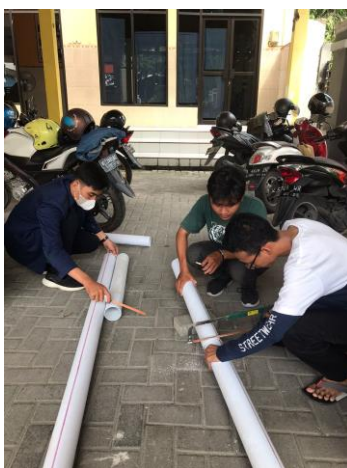
Gambar 1. Pembuatan Lubang Resapan Biopori

Setelah alat dan bahan dipersiapkan, Tim KKN-TR membuat Lubang Resapan Biopori sebanyak sepuluh buah sepanjang 80 cm. Sisi Lubang Resapan Biopori diberi lubang agar air dapat mudah masuk ke pori-pori tanah dan laju resapan air lebih cepat. Cara kerja lubang resapan biopori ini adalah dengan adanya organisme tanah yang menguraikan sampah organik yang ditanam dalam lubang. Sampah menjadi sumber energi bagi organisme tersebut (Marwanto & Muallim, 2021).