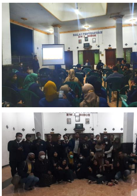
Gambar 2. Sosialisasi Lubang Resapan Biopori

Sosialisasi tim KKN-TR dilakukan di balai Dusun Boboh yang dihadiri oleh perangkat Dusun Boboh, karang taruna dan Masyarakat. Perangkat Dusun, karang taruna dan masyarakat diberikan pemahaman oleh tim KKN-TR mengenai fungsi dan manfaat Lubang Resapan Biopori (LRB) dan pembuangan sampah organic di LRB tersebut. Manfaat Lubang Resapan Biopori (LRB) yaitu : mencegah banjir, tempat pembuangan sampah organic, menyuburkan tanaman dan meningkatkan kualitas air tanah (Sanitya & Burhanudin, n.d.). Lubang Resapan Biopori yang ditanaman di Desa Boboh dapat mengurangi genangan air pada saat musim hujan dan sebagai tempat sampah organic. Harapan Tim KKN-TR, Masyarakat Desa Boboh mengerti tentang fungsi dan manfaat Lubang Resapan Biopori dan dapat membuat sendiri dengan peralatan yang sederhana.