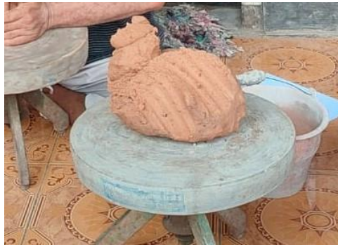
Gambar 4. Contoh tanah sawah yang sudah di olah

gerabah atau keramik bakaran rendah, tanah ini biasanya banyak dijumpai di beberapa wilayah di Jawa Timur, tanah ini memiliki kecenderungan lebih warna gelap, akan tetapi setelah dilakukan pembakaran maka hasilnya tetap menjadi warna merah batah.