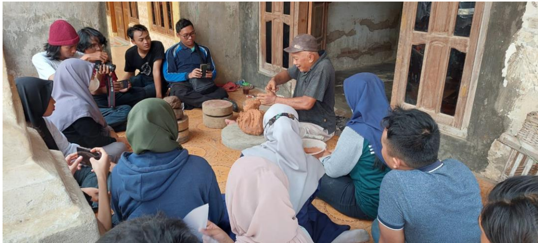
Gambar 2. Peserta mendapatkan pelatihan pengolahan tanah, sumber: (foto pribadi, Oktober 2021)

terdiri dari ruang lingkup dari gerabah, sejarah singkat perkembangan dari gerabah nusantara bagian kedua yaitu pengenalan teknik-teknik yang digunakan dalam kerajinan gerabah. Yang ketiga pengolahan tanah sawah sebagai bahan dasar dari gerabah seni ini. Pengolahan tanah juga menerangkan tentang bagaimana mengolah tanah yang berasal dari tanah sawah, kemudian diolah menjadi bahan dasar dari gerabah yang baik, pengolahan tanah ini sangat penting karena yang menentukan baik tidaknya hasil dari gerabah juga ditentukan oleh bagus tidaknya tanah yang dijadikan sebagai bahan dasar gerabah.