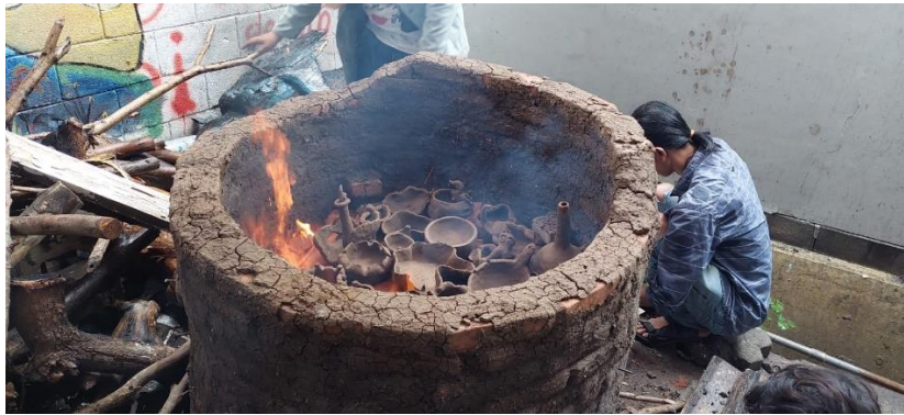
Gambar 8. Peserta melakukan praktik proses pembakaran,: (foto pribadi, 2021)