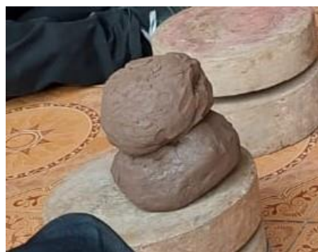
Gambar 3. Contoh tanah sawah yang sudah di olah

Pemahaman tentang tanah untuk bahan dasar terutama pengenalan karakter tanah mana yang bisa digunakan untuk gerabah sangat penting terutama bagi mahasiswa yang menjadi peserta, dimana mereka berasal dari daerah-daerah yang memiliki kondisi dan jenis tanah yang berbeda. Pada sebagian wilayah ada tanah yang memiliki karakter kandungan pasrinya lebih tinggi dari kandungan plastisinnya dan sebaliknya ada beberapa wilayah yang memiliki karakter tanah yang kandungan plastisinnya lebih tinggi dari kandungan pasirnya.