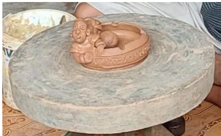
Gambar 10. Salah satu contoh Hasil gerabah jadi, sumber: (foto pribadi, 2021)