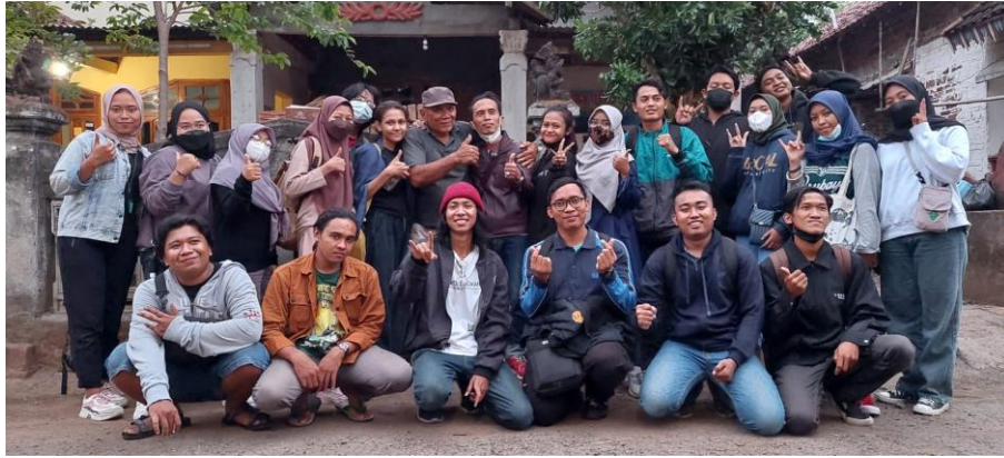
Gambar 11. Peserta pendampingan gerabah pada hari ketiga