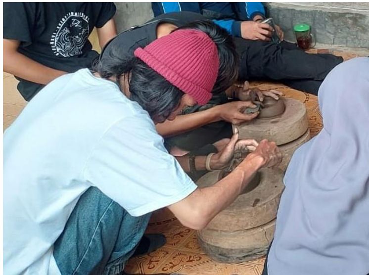
Gambar 7. Proses praktik gerabah seni