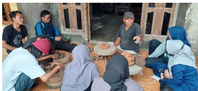
Gambar 6. Proses pembuatan keramik, sumber: (foto pribadi,Oktober 2021)

Tahap selanjutnya setelah proses proses pembuatan Desain yaitu proses pembuatan gerabah berdasarkan desain yang sudah dibuat oleh setiap peserta. Pada tahap ini peserta juga mendapatkan beberapa masukan dari pak kadir sebagai salah satu pematari pada pendampingan pembuatan gerabah seni.