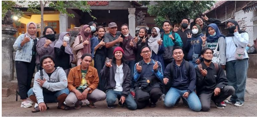
Gambar 1. Peserta pelatihan, sumber: (foto pribadi, Oktober 2021)

Dari hasil analisis wawancara, observasi dan dokumentasi terhadap objek pengabdian, dirumuskan sebuah metode proses pembuatan gerabah seni serta modul yang sesuai dengan permasalahan yang aktual terjadi di lapangan yaitu di Desa Kedungsari kecamatan Tarokan Kabupaten Kediri. Beberapa temuan yang didapat bahwasanya masyarakat Kedungsari memiliki kecenderungan mempertahankan kebiasaan atau pola-pola yang sudah terbentuk dari era sebelumnya, masyarakat tempatan lebih mempertahankan karya-karya gerabah yang diturunkan dari nenek moyong mereka, sehingga desain dan pola karya yang dihasilkan stagnand atau kurang bisa untuk melakukan beberapa perubahan atau inovasi. Kebiasaan ini juga mempengaruhi daya saing dalam penjualan yang dihasilkan dari produk gerabah yang masih bersifat tradisional. Masyarakat Kedungsari masih belum bisa mengembangkan desain gerbah yang memiliki unsur seni atau dalam hal karya gerbah selain sebagai produk fungsional juga produk yang dihasilkan bersifat estetik.