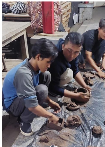
Gambar 7. Peserta melakukan praktik gerabah,: (foto pribadi, 2021)

Hari ketiga minggu 31 Oktober 2021, pelaksanaan pendampingan gerabah seni dilakukan pada pukul 08.00 WIB pagi, hal ini bertujuan agar kegiatan ini memiliki waktu yang panjang, sehingga hasil diharapkan lebih maksimal proses pembuatan gerabah seni yang terdiri 10 mahasiswa dan 10 masyarakat Kedungsari. Pada tahapan terakhir yaitu proses pembakaran keramik. Pada proses pembakaran ini memerlukan waktu yang sangat panjang yaitu antara 6 jam sampai 8 jam pembakaran dimana suhu yang diperlukan antara 500c sampai 700c. Pada proses pembakaran keramik yang sudah jadi disusun dengan rapi dan setiap gerabah ditata bersentuhan dengan gerabah lainnya, hal ini untuk mendapatkan pemanasan yang merata.