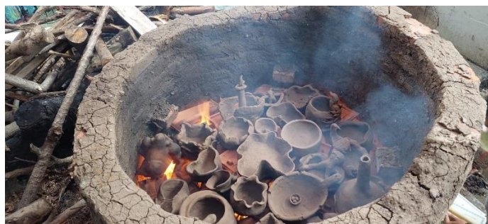
Gambar 9. Peserta pendampingan mural istirahat pada hari kedua