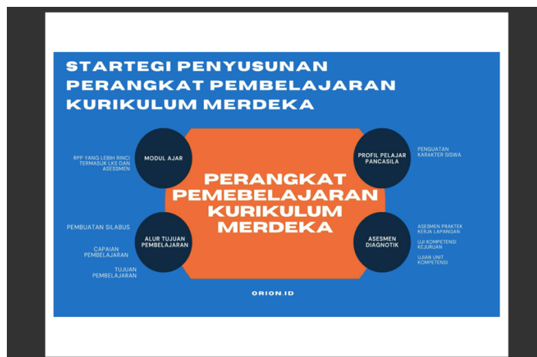
Gambar 2. Peta Konsep Perangkat Pembelajaran