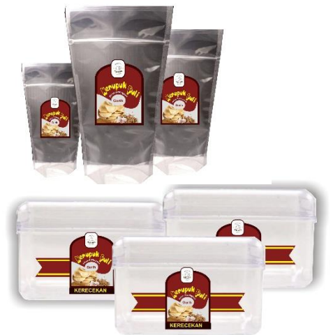
Gambar 3. Aktivitas Desain dan Aplikasi pada Kemasan

Dua desain yang diterapkan yaitu untuk desain bahan baku atau kerecekan dan produk jadi. Untuk desain produk bahan mentah atau krecekan sendiri dipastikan dengan dua model yaitu; box kotak dipergunakan untuk krecekan dengan bobot 500 gram dan box bulat dipergunakan untuk bobot 750 gram. Selanjutnya untuk bahan produk jadi pouch bag dipergunakan untuk kerupuk puli dengan bobot 250 gram kering. Selanjutnya untuk desain secara utuh dari gambaran di atas, jika dipasangkan pada ukuran sebenarnya dapat dilihat pada gambar 4 di bawah ini.