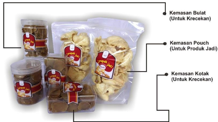
Gambar 4. Pemasangan Branding pada Kemasan Asli (Kerupuk & Kerecekan)