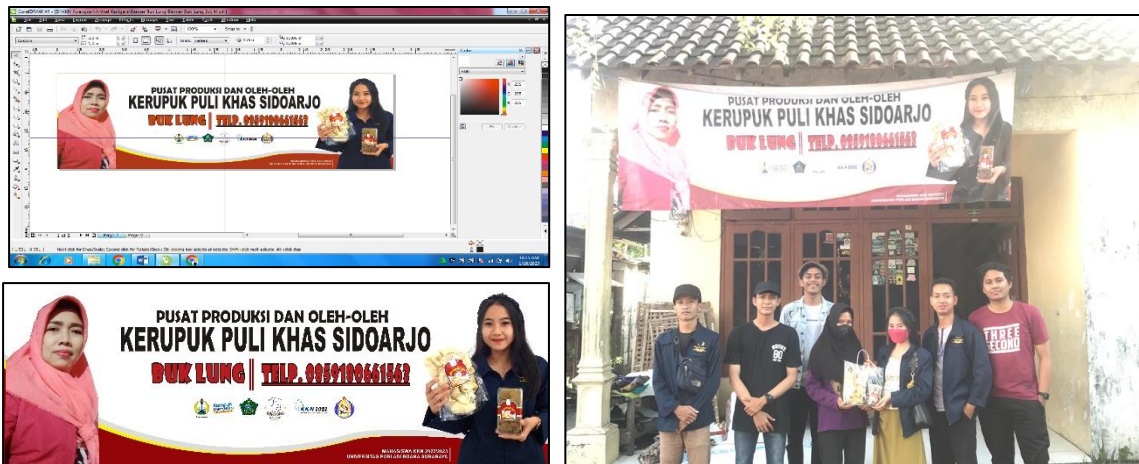
Gambar 5. Pemasangan Fasilitas Pendukung Usaha

Fasilitas pendukung kaitannya dengan upaya pemasaran dan informasi tempat produksi. Fasilitas pendukung seperti spanduk, beberapa brand (merek) serta sampling kemasan diberikan kepada pelaku usaha.