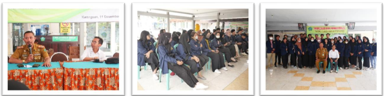
Gambar 1. Pembukaan dan penyerahan peserta KKN di Desa Kwangsari

Pembukaan kegiatan KKN di Desa Kwangsari Kecamatan Sedati Kabupaten Sidoarjo diawali dengan penyerahan sejumlah 31 mahasiswa oleh Dosen Pembimbing Lapangan kepada Kepala Desa Kwangsari. Penyampaian program kerja yang meliputi; Kesehatan, Pendidikan, Keamanan, Pengasuhan, Kreatif-Produktif dilakukan secara detail melalui pemaparan proposal yang sudah dibuat oleh mahasiswa sebelumnya. Penerimaan oleh pihak desa yang secara langsung diterima oleh Kades juga memberikan umpan balik bahwa proses awal berjalan dengan baik.