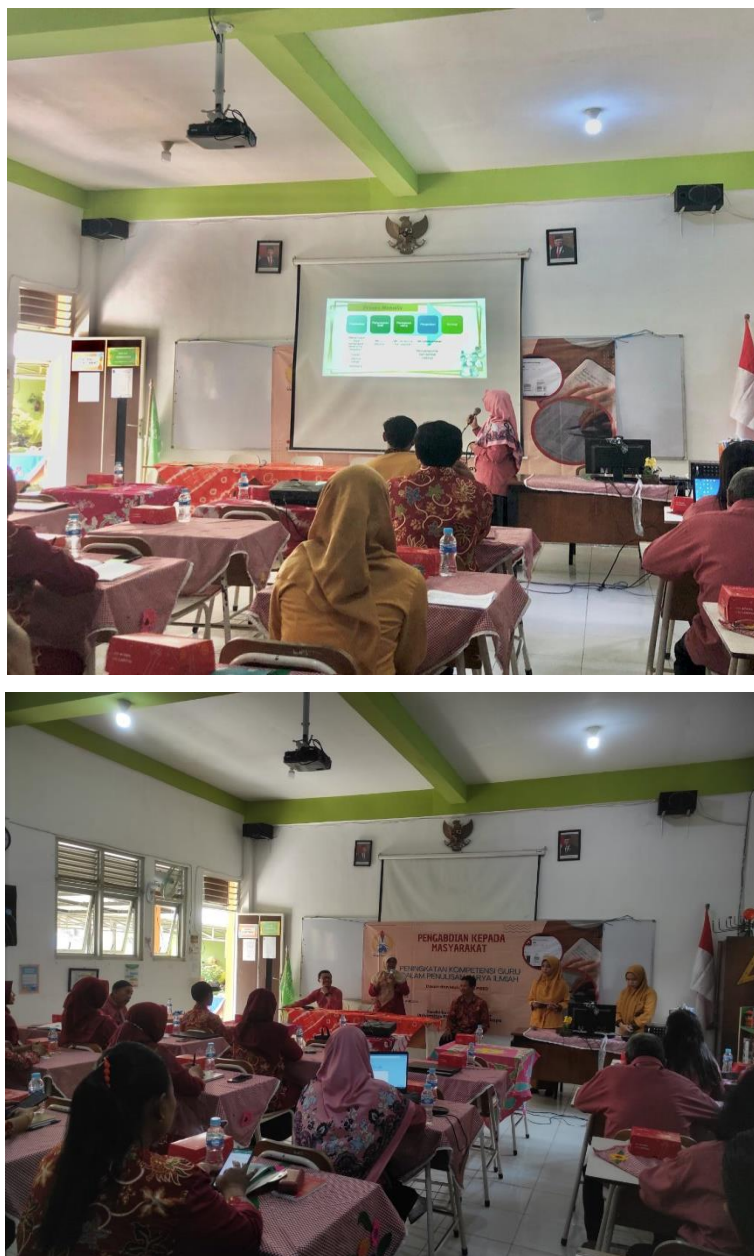
Gambar 1. Dokumentasi PkM