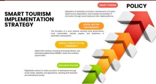
Gambar 2. Strategi Implementasi Smart Tourism

Dari hasil analisis data yang ditunjukkan pada Tabel 4. , keberhasilan implementasi pariwisata pintar sangat ditentukan oleh tiga pilar utama: kebijakan inklusif, literasi digital masyarakat, dan kemitraan lintas sektoral. Daerah yang memiliki komitmen politik yang kuat dan ekosistem pendukung yang memadai, seperti Banyuwangi, dapat menunjukkan hasil yang lebih konkret dibandingkan daerah lain yang masih dalam tahap pembangunan. Temuan ini merupakan dasar penting bagi pengembangan model pengembangan pariwisata cerdas yang kontekstual, berorientasi pada penguatan kapasitas lokal, dan selaras dengan Sustainable Development Goals (SDGs), terutama dalam hal pengentasan kemiskinan, peningkatan lapangan kerja, dan konservasi lingkungan pesisir.