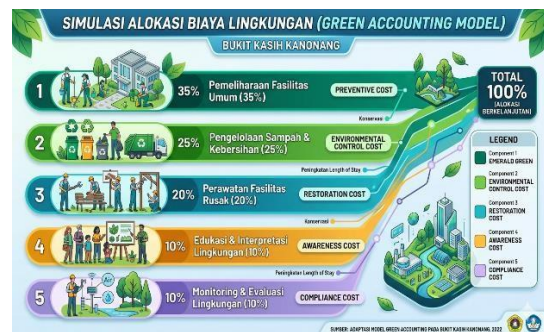
Gambar 3. Simulasi alokasi biaya lingkungan

yang masih alami, yang secara konseptual dapat diposisikan sebagai aset lingkungan bernilai ekonomi tinggi. Namun, kelemahan berupa fasilitas rusak dan kurang terawat mencerminkan tidak adanya sistem pencatatan biaya pemeliharaan dan investasi lingkungan secara akuntabel. Di sisi eksternal, meningkatnya tren wisata spiritual dan digitalisasi membuka peluang untuk menerapkan pelaporan keberlanjutan berbasis digital sebagai bagian dari transparansi pengelolaan. Sebaliknya, keberadaan destinasi pesaing yang lebih modern menjadi ancaman serius karena dapat menyebabkan hilangnya nilai ekonomi lingkungan apabila aset ekologis tidak dikelola dan dicatat secara sistematis. Secara keseluruhan, tabel ini menekankan urgensi integrasi Green Accounting sebagai instrumen strategis dalam menjaga daya saing dan keberlanjutan destinasi.