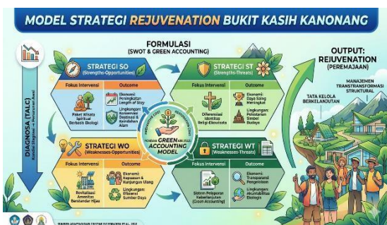
Gambar 4. Model Strategi Rejuvenation Bukit Kasih Kanonang

menjaga kelestarian dengan pemandangan alam pegunungan. Strategi WO berfokus pada revitalisasi amenitas berstandar hijau untuk meningkatkan kepuasan dan repeat visitor melalui efisiensi penggunaan sumber daya. Strategi ST diarahkan pada diferensiasi identitas religi dan ekowisata guna memperkuat daya saing sambil melestarikan simbol budaya dan nilai spiritual. Sementara itu, strategi WT menitikberatkan pada penerapan sistem pelaporan keberlanjutan sebagai instrumen transparansi pengelolaan dan akuntabilitas ekologis. Secara keseluruhan, model ini menekankan bahwa proses rejuvenation tidak hanya bertujuan memulihkan pertumbuhan kunjungan, tetapi juga membangun sistem pengelolaan destinasi yang berkelanjutan dan berbasis nilai lingkungan.