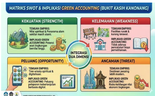
Gambar 2. Matriks SWOT

Perbandingan antara subtotal peluang (1,35) dan ancaman (0,85) memang menunjukkan peluang lebih besar, tetapi rendahnya rating pada beberapa faktor strategis mengindikasikan bahwa destinasi belum sepenuhnya mampu memanfaatkan peluang tersebut secara optimal.