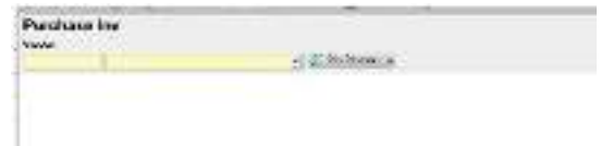
Gambar 1. 2 Fitur faktur pembelian pada Accurate

Berdasarkan gambar di atas, kelengkapan fitur yang ada pada Accurate menarik informan untuk semakin mempelajari Accurate. Tidak seperti Excel, kini Accurate menyediakan fitur - fitur yang berhubungan langsung dengan perpajakan Indonesia.