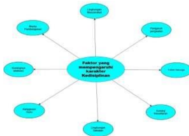
Gambar 4. Project Map Factor yang Mempengaruhi Kedisiplinan

Dalam upaya meningkatkan kedisiplinan di kalangan peserta didik, berbagai faktor perlu dipahami dan dikelola dengan baik. Kedisiplinan tidak hanya terbentuk dari aspek akademik, tetapi juga dipengaruhi oleh berbagai elemen dalam kehidupan sehari-hari peserta didik, seperti lingkungan keluarga, interaksi sosial dengan teman sebaya, dan peran guru di sekolah. Salah satu aspek penting yang mempengaruhi kedisiplinan adalah kesadaran peserta didik terhadap pentingnya disiplin itu sendiri seperti Gambar 4.