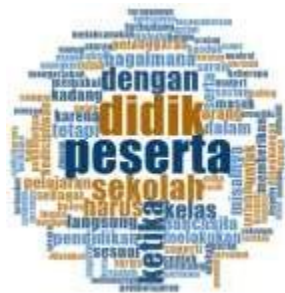
Gambar 2. Objek Kata Wawancara Guru Pendidikan Pancasila (Word Cloud)

Dari analisis wawancara dengan NVivo seperti Gambar 1., Word Frequency Query merupakan fitur penting yang membantu peneliti menampilkan frekuensi kata-kata yang menarik. Perolehan dari pencarian menunjukkan bahwa peserta didik lebih dominan dalam melakukan pelanggaran di lingkungan sekolah seperti Gambar 2.