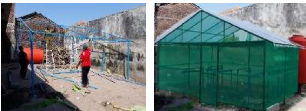
Gambar 1. Rumah kaca yang diperuntukkan buat Mitra dan siap digunakan sebagai tempat budidaya sayuran secara hidroponik.

Rumah kaca yang telah dibangun di lokasi Mitra mempunyai luasan sebesar 36 m 2 dengan rangka terbuat dari besi, beratapkan plastik UV (10%) dan bagian sampingnya tertutup jaring serangga dari bahan nilon (Gambar 1). Pembangunan rumah kaca bagi Mitra ini mempunyai beberapa tujuan, yaitu: (1) menghindarkan terjadinya kerusakan sayuran akibat terpaan air hujan dan angin, sehingga kualitas sayuran tetap terjamin, (2) menghindari kerusakan sayuran akibat paparan sinar matahari yang berlebih pada musim kemarau, sehingga pertumbuhan sayuran tetap optimal dan tetap diperoleh panen sesuai jadwal, dan (3) menghindarkan serangan serangga dan pemakaian pestisida, sehingga sayuran yang dihasilkan bebas dari pestisida (racun).