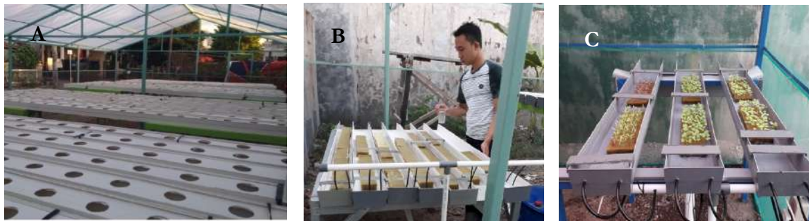
Gambar 2. Sistem hidroponik yang telah dibangun dilokasi Mitra: A. Gully sistem hidroponik yang siap digunakan untuk budidaya sayuran; B. Sistem semai; C. Hasil semaian yang siap digunakan untuk kegiatan pelatihan.

sayuran terbuat dari talang air warna putih yang telah dimodifikasi sedemikian rupa. Setiap gully mempunyai 22 lubang tanam, sehingga jumlah total lubang tanam sebanyak 16 gully x 22 lubang tanam = 352 lubang tanam. Kegiatan berikutnya setelah pembuatan rumah kaca dan sistem akuaponik adalah pembuatan sistem semai (Gambar 2.B) dan penyemaian benih (Gambar 2.C). Sistem semai terbuat dari talang air warna putih yang dibelah. Sistem semai ini mampu menampung 400 semaian. Setelah sistem selesai dibuat, Pengusul bersama mitra melakukan penyemaian sayuran bayam, kangkung dan sawi yang akan digunakan untuk kegiatan selanjutnya.