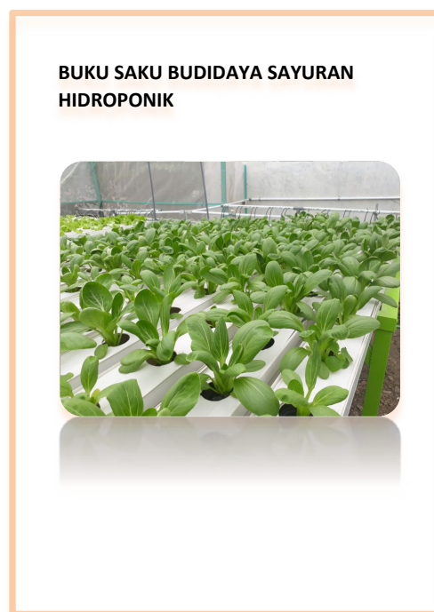
Gambar 5. Cover buku saku sayuran hidroponik

Untukantisipasi setelah kegiatan pengmas selesai dan pendampingan hanya akan dilakukan jarak jauh, maka tim pengabdian masyarakat juga membuat dan menyerahkan buku saku berisi panduan penanaman hidroponik kepada mitra. Buku tersebut diberi judul: “BUKU SAKU BUDIDAYA SAYURAN HIDROPONIK”. Buku ini sangat bermanfaat bagi mitra dari awal penyiapan tanaman sampai selanjutnya. Hal ini dikarenakan berisi panduan singkat cara menanam sayur hidroponik yang terdiri dari: (1) Penyiapan Rockwool, (2) Pelarutan Nutrisi AB mix kemasan 5 L, (3) Tahap Semai, (4) Pindah tanam, (5) Tahap Pembesaran, (6) Tahap panen, (7) Tahap Pembersihan talang. Sampul buku saku dapat dilihat pada Gambar 5. Dengan demikian tidak ada kekawatiran bagi mitra jika team Pengmas sudah tidak mendampingi lagi secara fisik. Meskipun mitra tetap dapat berhubungan dan berkonsultasi dengan tim pengmas kapanpun jika diperlukan. Secara keseluruhan kegiatan ini dianggap berhasil karena telah membantu Ibu-ibu PKK menghasilkan sayuran organik yang sehat, bergizi dan dapat panen setiap dua bulan. Cover BUKU SAKU SAYURAN HIDROPONIK dapat dilihat pada Gambar 5.