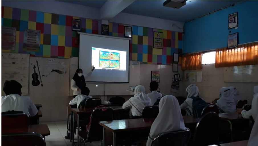
Gambar Pelaksanaan Bimbingan Mendongeng

Hasil tes bakat minat mendongeng siswa mengarahkan pada hasil bahwa kepribadian yang baik akan muncul dengan baik dengan bantuan beberapa model pembelajaran yang baik. Jenis model pembelajaran itu adalah mendongeng. Akan tetapi hal yang membuat anak anda bahagia dan selalu berimajinasi ketika ia bercerita. Bercerita sering kita sebut dengan mendongeng.