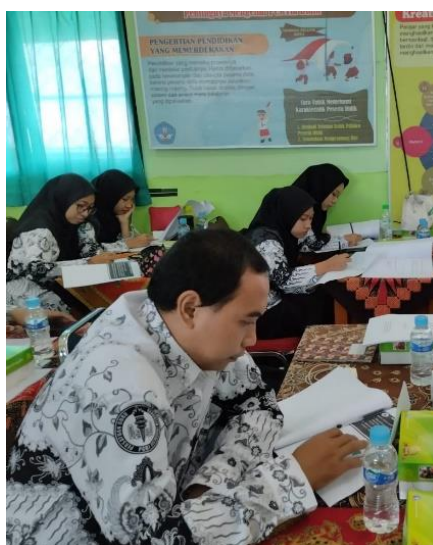
Gambar 2. Pelaksanaan Pendampingan Kegiatan Praktik Laboratorium SD

Kegiatan selanjutnya adalah melaksanakan pendampingan kepada guru-guru dalam mengembangkan draft rancangan pengembangan kegiatan praktik laboratorium di SD. Masing-masing guru melanjutkan draft rancangan tersebut sampai selesai sehingga dapat diaplikasikan dalam kegiatan praktik laboratorium untuk mengoptimalkan capaian tujuan pembelajaran di SD. Kegiatan pendampingan dilakukan oleh tim pengabdian yaitu dosen dan mahasiswa kepada guru-guru di sekolah mitra.