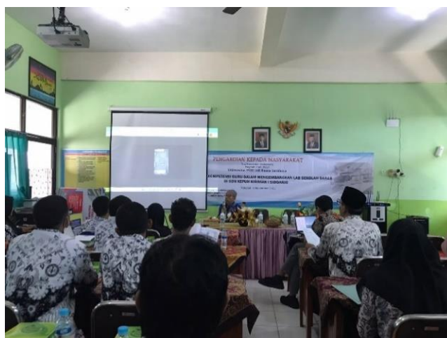
Gambar 1. Guru Merancang Pengembangan Kegiatan Praktik Laboratorium di SD