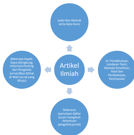
Gambar 2. Sistematika artikel ilmiah

Beberapa hal penting yang harus diperhatikan oleh para guru ketika menulis karya ilmiah adalah aspek-aspek penting yang harus ada didalamnya. Terdapat banyak sekali sumber rujukan tentang sistematika penulisan karya ilmiah. Oleh karena itu, diperlukan sumber rujukan yang pasti sehingga benar-benar menjamin referensi yang jelas sebagai acuan dan artikel ini menggunakan sumber dari LIPI yang disusun pada tahun 2012. Dengan adanya sumber yang pasti dan terpercaya, guru sebagai penulis artikel ilmiah yang mengikuti bimbingan teknis juga akan memiliki acuan yang jelas. Meskipun demikian, para guru pada saat akan mengirimkan artikel pada jurnal sasaran tetaplah harus mengikuti standar penulisan yang ditetapkan oleh pengelola jurnal. Secara garis besar aspek-aspek tersebut sebagaimana di dalam informasi tabel/grafis berikut: