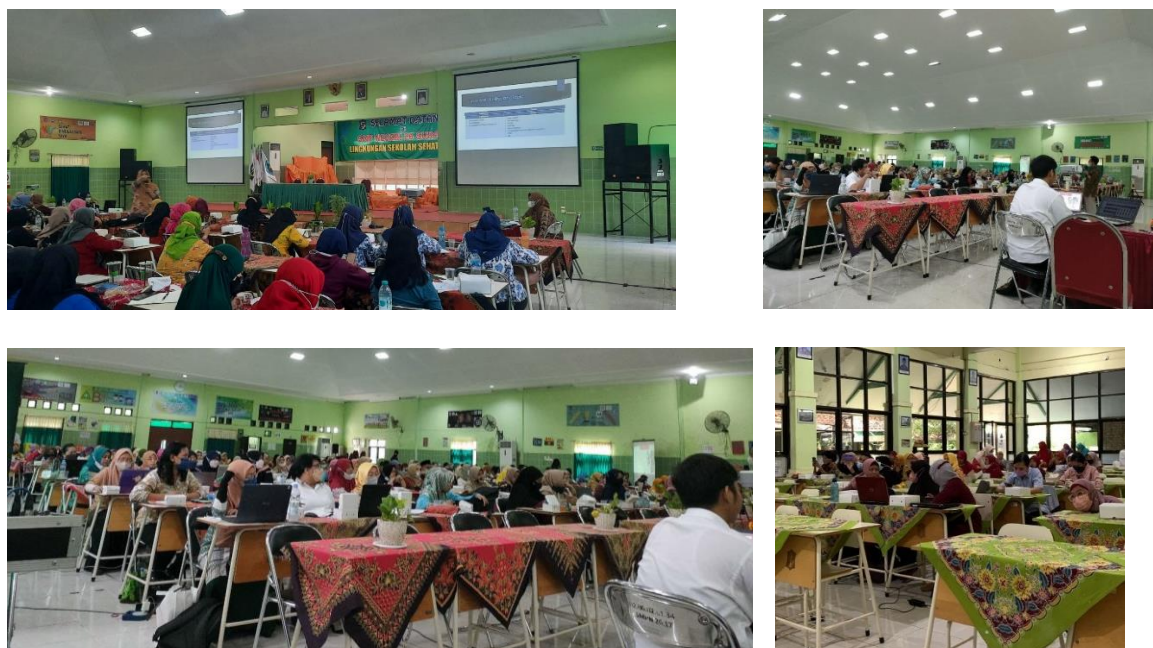
Gambar 1. Dokumentasi kegiatan PPM