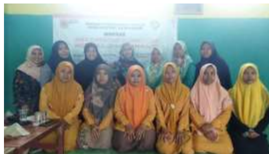
Gambar 2. Kegiatan Seminar Implementasi Kurikulum Merdeka

Adapun foto kegiatan pengabdian kepada masyarakat di RA/BA/TA Muslimat NU Terpadu Al- Wardah di bawah ini: