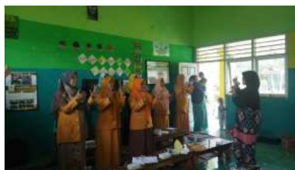
Gambar 3. Pemaparan Narasumber

Kemudian dilanjutkan pemaparan narasumber seminar implementasi kurikulum merdeka: