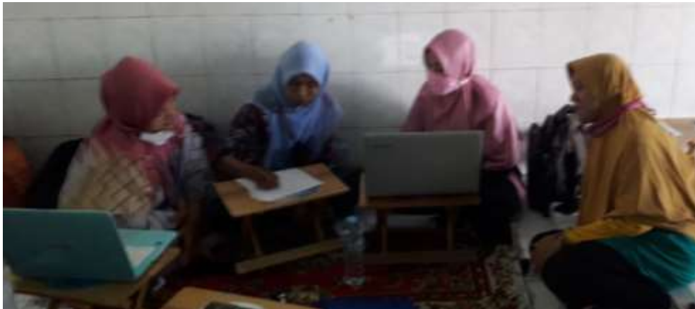
Gambar 5. Kegiatan Pelatihan Mengembangkan Modul Ajar Kearifan Lokal