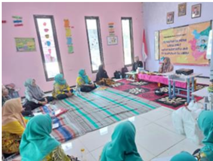
Gambar 2. Kegiatan pelatihan kepada guru PAUD Islam Pluz Az Zahra Pakal Surabaya di sekolah