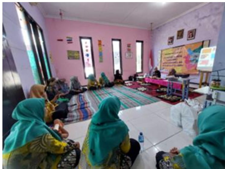
Gambar 3. Para guru mengikuti pelatihan pembelajaran dengan menggunakan media Loose Part dengan tertib dan semangat