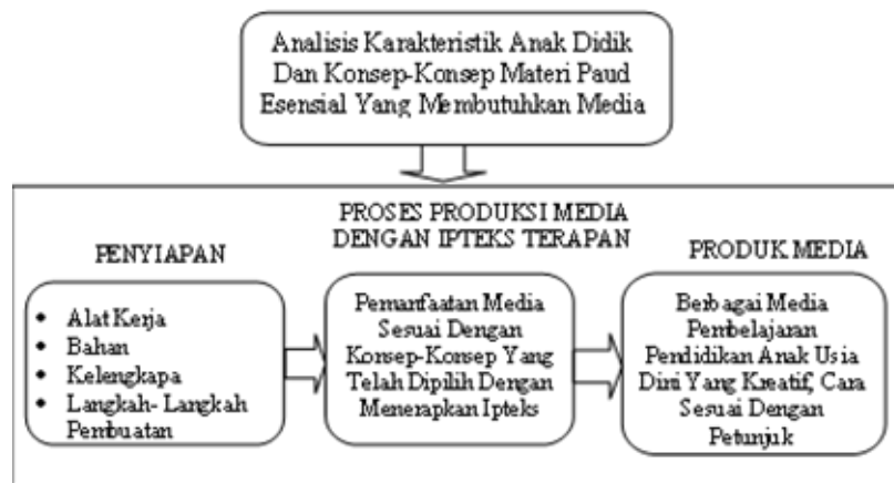
Gambar 1. Diagram desain/perancangan media Loose Part

Berikut dijelaskan analisis kebutuhan yang ditawarkan dalam upaya memanfaatkan media pembelajaran Pendidikan Anak Usia Dini yang menggunakan Loose Part dalam pembelajaran. Proses desain/perancangan media Loose Part dalam pembelajaran PAUD yang meningkatkan kreatifitas Guru PAUD bisa dilihat sebagai berikut: