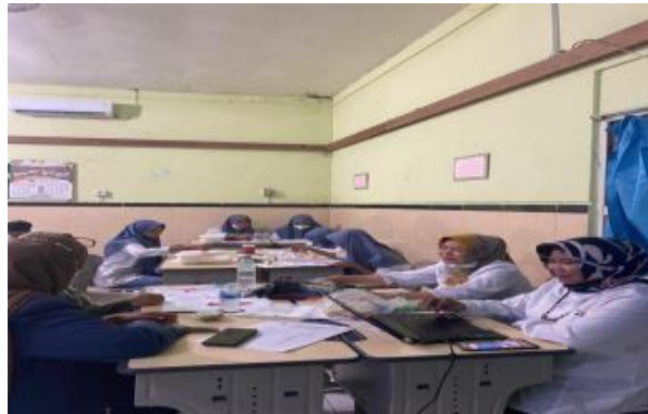
Gambar 1. Tim narasumber memberikan pendampingan saat praktek