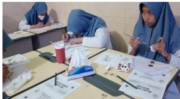
Gambar 3. Siswa praktek

Penguasaan Konsep Lukis di Atas Kain: Siswa dapat memahami konsep dasar melukis di atas kain, seperti warna, teknik aplikasi, dan komposisi. Hal ini memungkinkan mereka berkreasi lebih leluasa dan menghasilkan karya yang berkualitas.