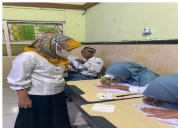
Gambar 2. Tim narasumber memberikan pendampingan