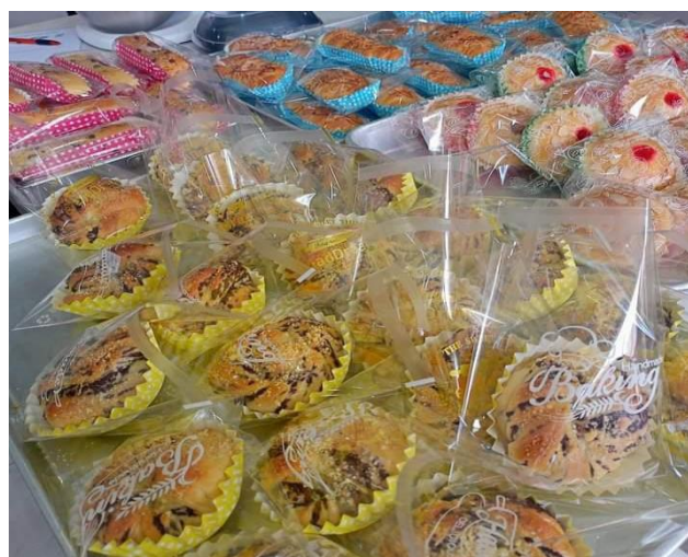
Gambar 4. Kemasan Produk Sweet bread