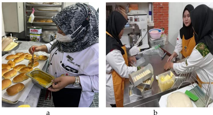
Gambar 2. a,b Uji coba resep di Laboratorium Tata Boga