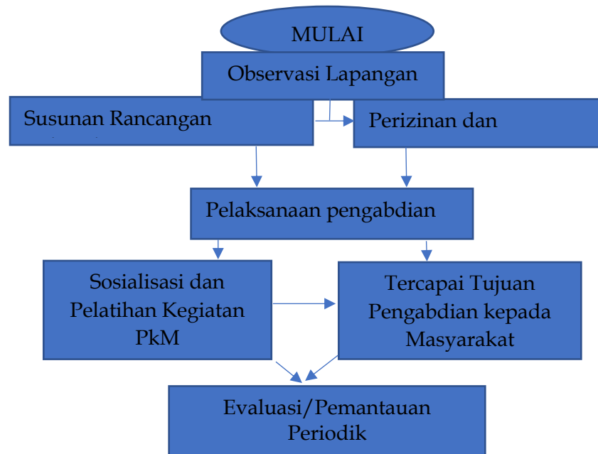
Bagan 1. Tahap Pelaksanaan Kegiatan

Pelaksanaan kegiatan PkM ini terdiri atas dua tahap, yakni 1) tahap perencanaan, Pada tahap pelaksanaan, langkah kegiatan yang dilakukan a) merumuskan tujuan dan sasaran, b) menganalisis kebutuhan guru, c) merancang bahan presentasi “penulisan PTK”, 2 ) tahap pelaksanaan, dan 3) tahap evaluasi. Rincian pelaksanaan PkM dapat dilihat dalam bagan berikut ini.