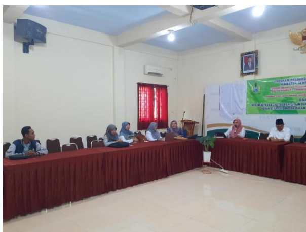
Gambar 3. Peserta dosen saat melakukan diskusi