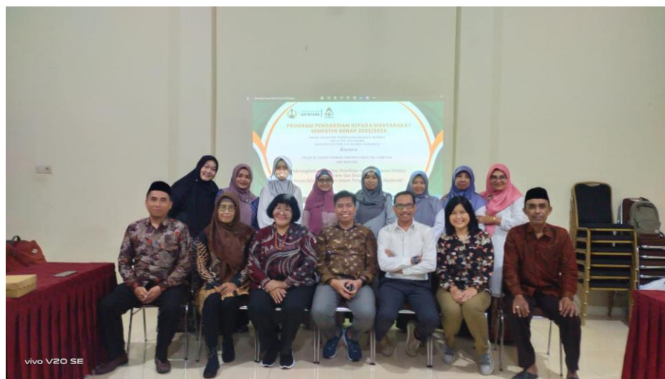
Gambar 5. Sesi praktek dan pendampingan

mereka dibantu oleh tim mahasiswa untuk mendampingi pada saat praktek serta membantu para peserta yang mengalami kendala. Para dosen nampak sangat awam dengan Book Review di Web of Science. Beberapa kali mereka bertanya dan beberapa dari mereka juga membutuhkan beberapa waktu lamanya untuk melanjutkan ke tahapan berikutnya. Untuk itu mereka sangat perlu didampingi dan diberikan pelatihan ini. Setelah selesai praktek, para peserta tetap diberikan pendampingan melalui Whatsapp Group ataupun email. Hal ini diharapkan dapat membantu mereka menyelesaikan tugas yang yang diberikan setelah pelatihan, yakni tugas Menyusun dan menavigasi book review. Para peserta akan mendapatkan sertifikat setelah mereka mengumpulkan tugas- tugas mereka.