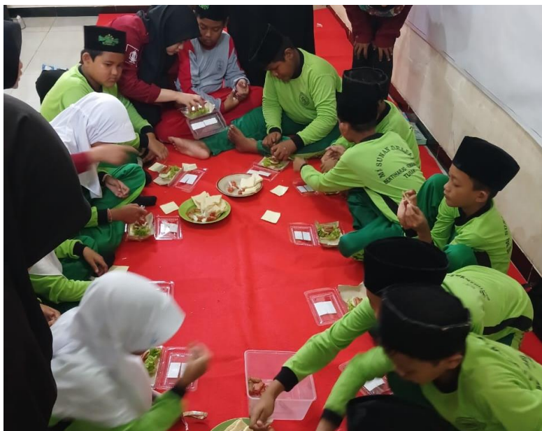
Gambar 1 : Siswa mempraktekkan membuat sandwich

Berikut beberapa dokumentasi hasil kegiatan Create Your Own Business :