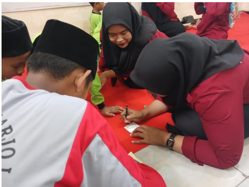
Gambar 2 : Siswa membuat gambar yang akan dijadikan sebagai logo

Selama pelaksanaan kegiatan, siswa menunjukkan antusiasme tinggi dalam menyusun ide bisnis, memproduksi barang/jasa, melakukan promosi, dan menjual produk. Mereka juga belajar menghadapi tantangan nyata seperti pembagian peran, konflik ide, serta pengelolaan waktu dan modal. Berdasarkan hasil wawancara yang dilakukan, sebagian besar siswa menyatakan bahwa kegiatan ini membuat mereka lebih percaya diri untuk berwirausaha, lebih menghargai proses dan kerja keras, juga tertarik untuk mengembangkan usaha secara nyata.