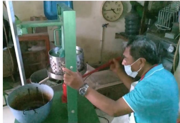
Gambar 8. Pelatihan Penggunaan Alat Pemeras