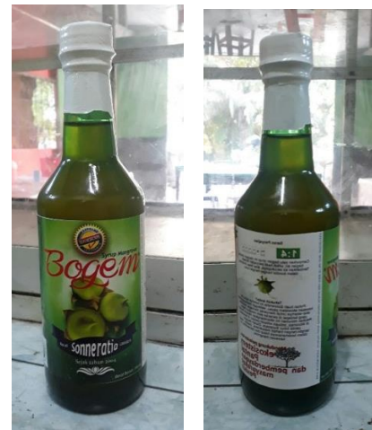
Gambar 3. Sirup mangrove “Bogem” yang Telah Jadi

Berikut beberapa gambar produk jadi sirup mangrove “Bogem”.