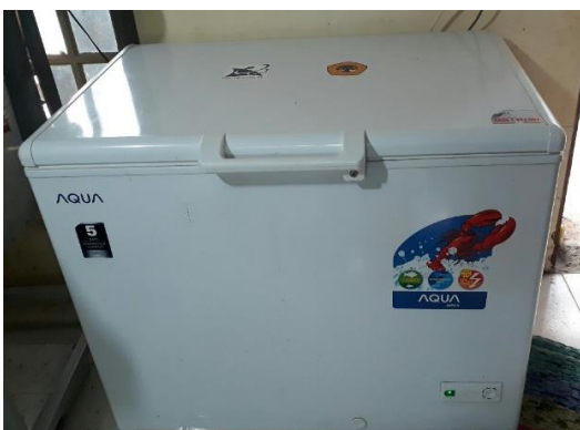
Gambar 7. Mesin Pendingin