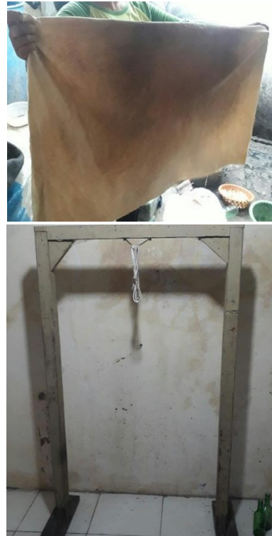
Gambar 4. Alat Pemeras yang Digunakan