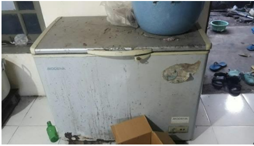
Gambar 5. Mesin Pendingin yang Rusak