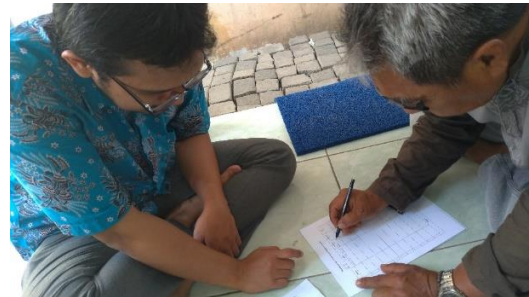
Gambar 9. Pelatihan Manajemen Pembukuan Sederhana