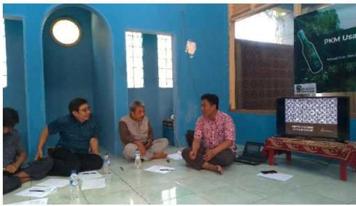
Gambar 10. Pelatihan Strategi Pemasaran