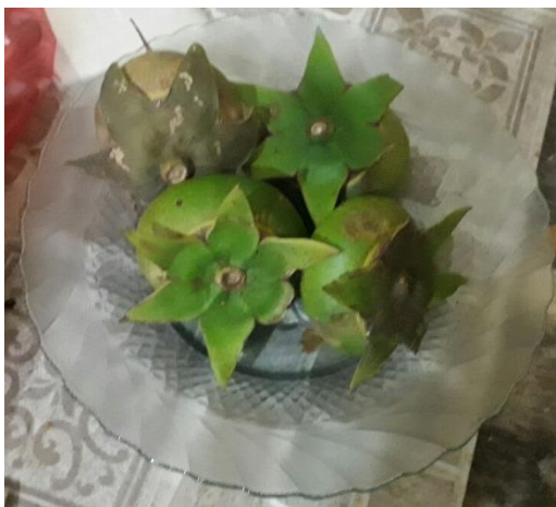
Gambar 1. Buah Mangrove

Di dalam hutan mangrove Surabaya terdapat 202 jenis tanaman dan setiap jenisnya memiliki spesies masing-masing. Tidak semua jenis mangrove dapat dikonsumsi, hanya 17 jenis mangrove yang dapat dimanfaatkan untuk makanan, minuman, obat-obatan dan kosmetik. Pedada ( Sonneratia caseolaris ) merupakan salah satu penyusun hutan bakau yang berada di sepanjang pantai berlumpur yang mempunyai salinitas rendah. Buah pedada berbentuk bulat, ujung bertangkai, dan bagian dasarnya terbungkus kelopak bunga. Buah ini memiliki diameter antara 6-8 cm dan biji berjumlah 800-1200 (Chen dkk. 2009). Buah pedada berwarna hijau, dan mempunyai aroma yang sedap. Buah pedada ini tidak beracun dan berasa asam. Buah pedada ini memiliki nama internasionalnya yaitu Crabapple mangrove (Ahmed dkk., 2010). Buah mangrove ini dapat dikonsumsi dan kulit kayunya dapat dimanfaatkan sebagai pewarna kain (Dewi dkk., 2014; Priyono dkk., 2010).