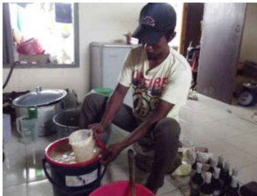
Gambar 2. Proses Pembuatan Sirup Mangrove “Bogem”

Berikut beberapa gambar produk jadi sirup mangrove “Bogem”.