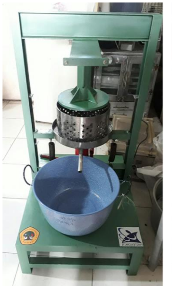
Gambar 6. Alat Pemeras