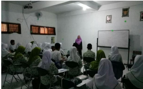
Gambar 1. Metode ceramah dalam training personality development

menggunakan metode pemutaran video, ceramah, simulasi games, personality test dan konseling. Selama proses training , mahasiswa nampak antusias mengikuti, terutama pada sesi personality test , games , dan konseling klasikal. Hal ini nampak dari hasil diskusi yang terjadi, serta antusiasme dalam merespon dan mengikuti kegiatan.