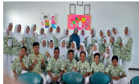
Gambar 3. Peserta training personality development

Hasil kegiatan pengabdian masyarakat ini adalah ketercapaian tujuan training yaitu pemahaman calon perawat (mahasiswa) tentang prospek karir perawat sehingga tumbuh optimisme akan pilihan karirnya, menumbuhkan kesadaran akan pengembangan kepribadian diri.