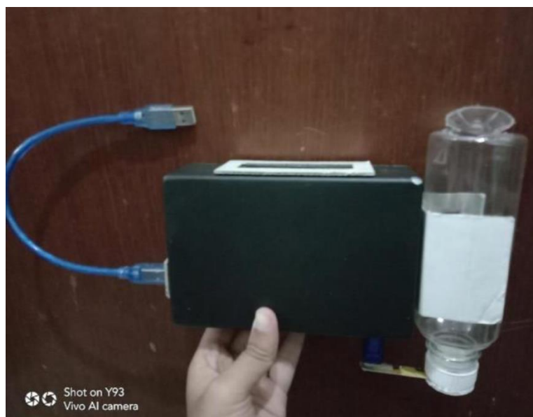
Gambar 2. Prototype alat pakan ikan otomatis

Dari rangkaian tersebut terdiri dari box elektronik untuk meletakkan alat perangkat keras yang disusun sedemikian rupa didalam box. Kemudian terdapat Arduino, motor servo, LCD, RTC, kabel A to B, Kabel Jumper male to female & male to male, dan juga botol sebagai tempat penampung pakan ikan. Alat ini dirancang sedemikian rupa agar dapat bekerja dengan baik. Dibawah ini terdapat gambar hasil dari rancangan pakan ikan otomatis.