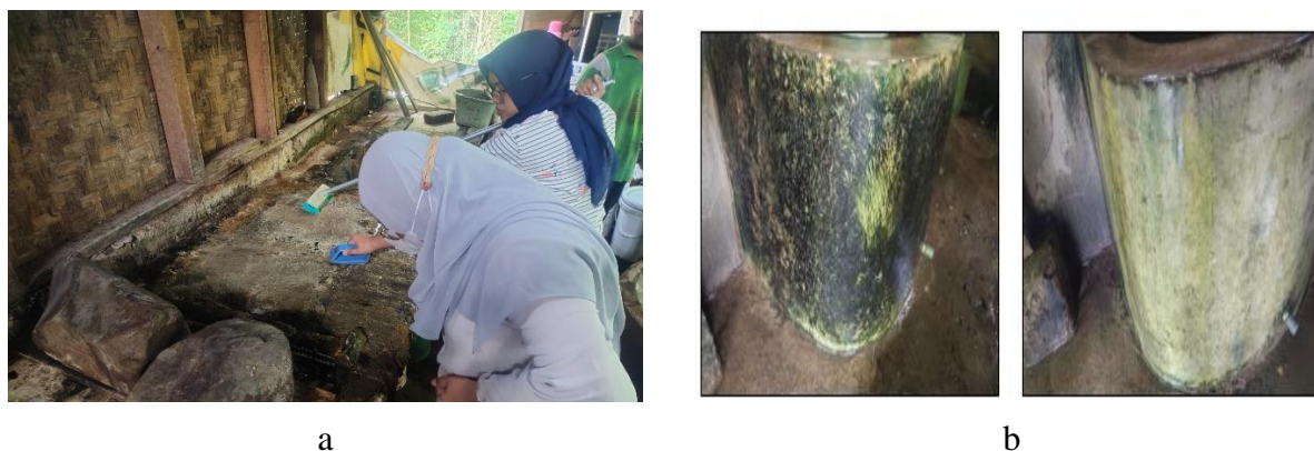
Gambar 1. Proses perbaikan sanitasi dalam ruang produksi (a) kegiatan pembersihan, dan (b) sebelum dan sesudah pembersihan bak penampung air

tahu 'Favorit' Cisalopa. Beberapa kegiatan dalam proses sanitasi dalam membersihkan lokasi produksi tahu Cisalopa dapat dilihat pada Gambar 1.