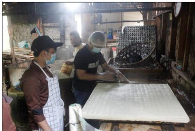
Gambar 3. Kegiatan produksi dimana karyawan telah menggunakan APD

penyakit tersebut hilang. Beberapa kebiasaan tersebut dikembangkan dalam upaya pengendalian titik kritis sanitasi pada fokus sanitasi karyawan seperti yang terlihat pada Gambar 3.