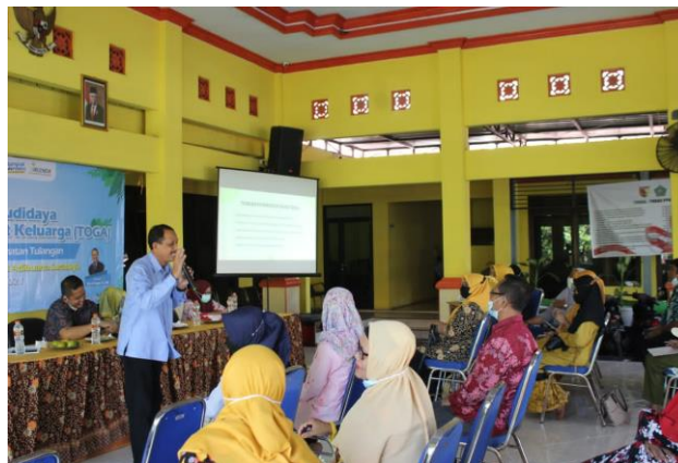
Gambar 3. Penyuluhan Budidaya Tanaman TOGA di Desa Kepatihan Tulangan Sidoarjo

Pemberian materi penyuluhan dilakukan oleh narasumber Adapun materi penyuluhan yang disampaikan antara lain yaitu penjelasan mengenai tanaman toga secara umum, jenis-jenis tanaman obat keluarga, khasiat tanaman toga, penanaman, pemeliharaan, serta materi pengolahan tanaman TOGA menjadi sebuah produk herbal secara sederhana,