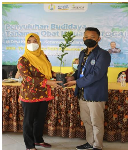
Gambar 4. Penyerahan Bibit Tanaman TOGA oleh mahasiswa kepada warga

Kegiatan penyuluhan ini diakhiri dengan Penyerahan 10 jenis bibit tanaman TOGA dari mahasiswa kepada masyarakat.