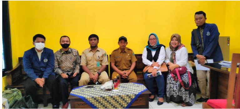
Gambar 2. Melakukan perizinan terhadap pihak pemerintah desa

Pemberian materi penyuluhan dilakukan oleh narasumber Adapun materi penyuluhan yang disampaikan antara lain yaitu penjelasan mengenai tanaman toga secara umum, jenis-jenis tanaman obat keluarga, khasiat tanaman toga, penanaman, pemeliharaan, serta materi pengolahan tanaman TOGA menjadi sebuah produk herbal secara sederhana,