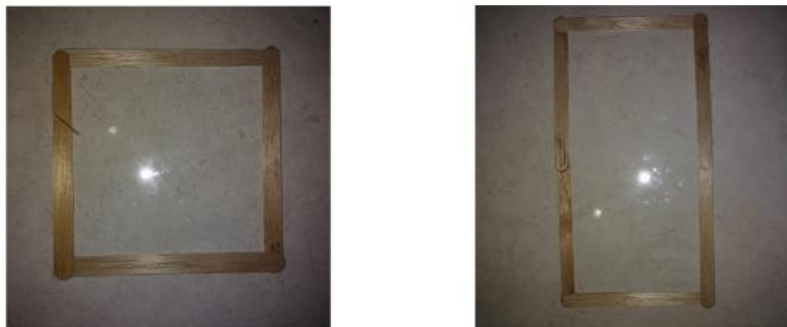
Gambar 3. Contoh Stik Bangun Datar