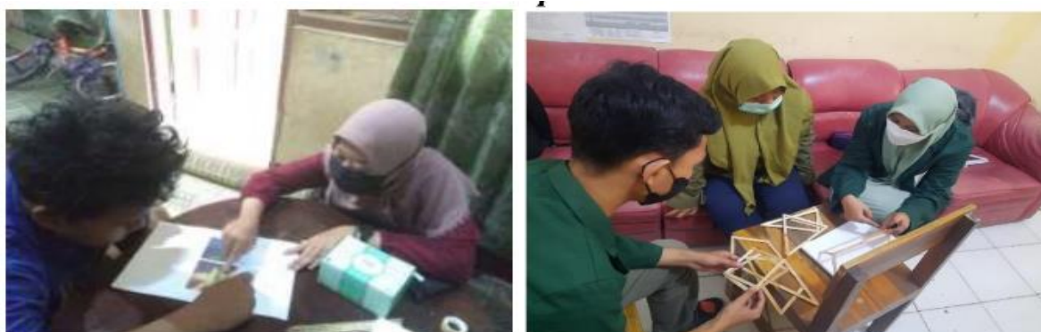
Gambar 4. Pendampingan belajar oleh tim pelaksana

Kegiatan pendampingan berlangsung 1-1,5 jam. Sebelum dilaksanakan pendampingan, siswa diminta untuk mengerjakan beberapa soal untuk mengetahui kemampuan awal siswa. Selanjutnya, untuk siswa 1 menggunakan pembelajaran dengan menggunakan RME berbasis Etnomatematika. Konteks-konteks etnomatematika yang digunakan adalah bangunan cagar budaya yang terletak di Yogyakarta seperti Kraton, Taman Sari, dan lain-lain. Hal ini bertujuan untuk menarik minat siswa dalam belajar dan memudahkan siswa dalam memahami materi bangun ruang. Sementara, untuk siswa 2, pembelajaran dilakukan dengan menggunakan bantuan alat peraga stik bangun datar. Tim pelaksana membuat stik bangun datar dan menggunakannya agar siswa slow learner dapat membayangkan bangun datar. Terdapat beberapa bangun datar yang dipelajari yaitu bangun persegi, persegi panjang, segitiga, layang-layang, trapesium, dan jajar genjang. Untuk siswa 1 dan siswa 2, siswa menunjukkan perkembangan yang cukup baik. Siswa mampu mengikuti dan memperhatikan pembelajaran dengan baik. Pada Gambar 4 tampak anak berkebutuhan khusus sedang diberikan pendampingan oleh tim pelaksana dengan bantuan alat peraga.