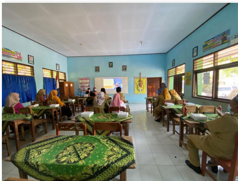
Gambar 3. Kegiatan sosialisasi Kurikulum merdeka khususnya mengenai Platform Merdeka Mengajar

Pendidikan Kecamatan Kesamben, Kepala Sekolah UPT SD Negeri Tepas 03, guru-guru di UPT SD Negeri Tepas 03, serta mahasiswa Kampus Mengajar angkatan 3 yang bertugas di SDN Tepas 03. Antusias warga juga dapat dilihat pada saat penyampaian materi banyak peserta yang melontarkan pertanyaan kepada pemateri sehingga suasana menjadi semangat.