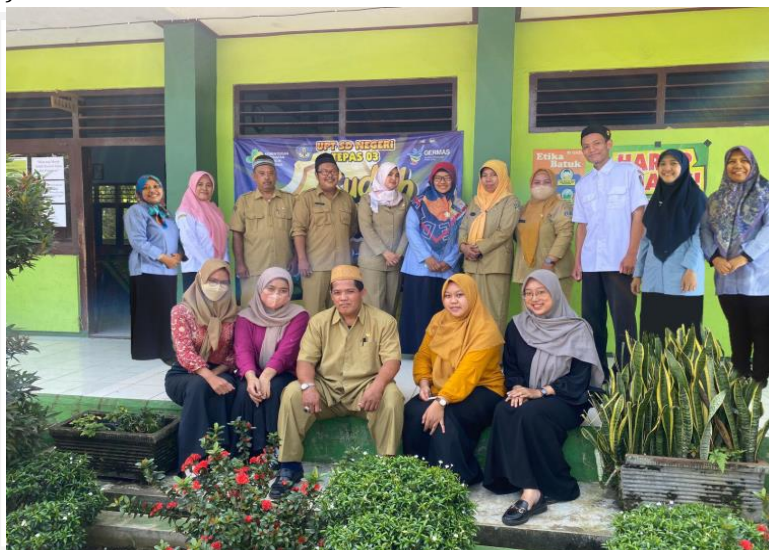
Gambar 3. Kegiatan Foto bersama setelah acara sosialisasi berakhir