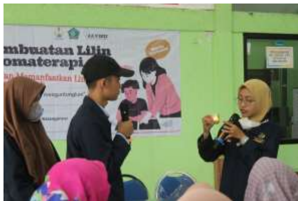
Gambar 1. Pemaparan materi

nilai jual. Lilin Aromaterapi akan menghasilkan aroma yang memberikan efek terapi saat dibakar. Manfaat dari lilin aromaterapi diantaranya untuk mengatasi insomnia dan mengurangi stress.