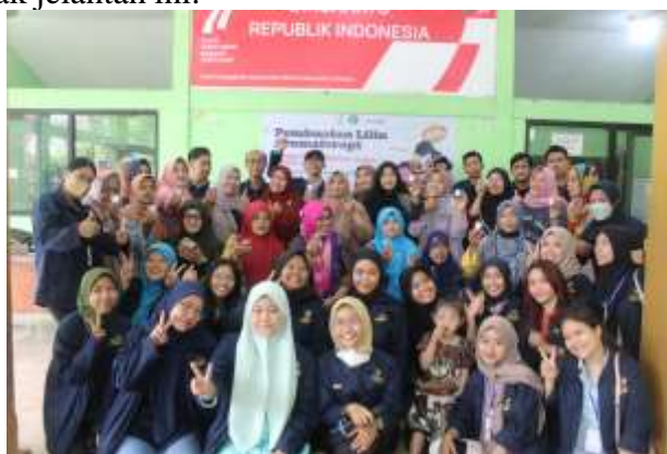
Gambar 3. Foto bersama setelah kegiatan sosialisasi

Evaluasi kegiatan ini ditinjau dari evaluasi selama proses dan evaluasi terhadap hasil. Program yang diselenggarakan ini mendapat respon positif dari ibu-ibu PKK dengan banyaknya antusiasme ibu-ibu PKK yang aktif bertanya saat kegiatan dilakukan. Banyak ketertarikan ibu-ibu PKK untuk membuat atau mempraktekkannya di rumah masing-masing, dan terdapat usulan dari ibu lurah desa kalanganyar bahwasannya Lilin Aromaterapi ini bisa digunakan sebagai souvenir khas dari Desa Kalanganyar. Diharapkan agar ibu-ibu rumah tangga di desa kalanganyar mendapatkan keuntungan ekonomis dari pembuatan lilin aromaterapi dari minyak jelantah ini.