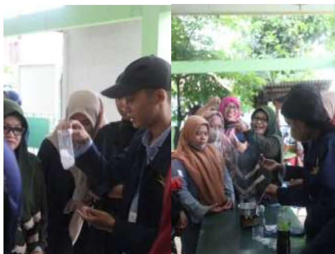
Gambar 2. Praktik Pembuatan Lilin Aromaterapi

Sosialisasi alternatif pemanfaatan minyak jelantah sebagai bahan dasar pembuatan lilin aromaterapi telah dilaksanakan dan secara keseluruhan berjalan lancar bertempat di balai desa kalanganyar, peserta yang hadir ialah anggota ibu-ibu PKK yang sebagian besar ialah ibu rumah tangga dan kerap kali memakai minyak goreng secara berulang. Para peserta sosialisasi dapat mendapatkan sosialisasi yang disampaikan dengan baik. Ada ketertarikan yang tinggi dari peserta untuk tahu lebih lanjut mengenai pemanfaatan minyak jelantah sebagai bahan dasar pembuatan lilin aromaterapi.