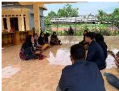
Gambar 1. Sosialisasi terkait NIB oleh pihak UMKM Kecamatan Krembung kepada Mahasiswa KKN (Rabu, 28 Desember 2022)