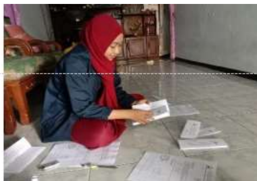
Gambar 3. Membuat undangan untuk pendaftaran NIB (Senin, 2 Januari 2023)