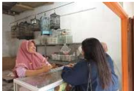
Gambar 2. Survey pelaku UMKM di Desa Gading yang belum memiliki NIB (Kamis, 29 Desember 2022)