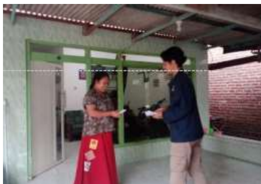
Gambar 4. Membagikan undangan bagi pelaku UMKM di Desa Gading yang belum memiliki NIB (Senin, 2 Januari 2023)