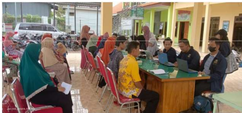
Gambar 5. Kegiatan pendaftaran NIB bagi pelaku UMKM di Desa Gading (Selasa, 3 Januari 2023)