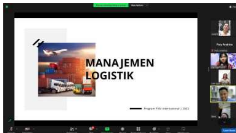
Gambar 3. Dokumentasi Sesi Pemaparan Materi

Sesi pemaparan materi oleh dosen Universitas Ciputra Surabaya dilakukan selama kurang lebih 1,5 jam. Sesi ini juga diselengi dengan sesi tanya jawab yang bertujuan untuk memberikan kesempatan bagi para partisipan untuk bertanya mengenai hal yang masih belum dipahami maupun studi kasus yang ditemui pada bisnis yang mereka jalani. Sejumlah mahasiswa Universitas Ciputra Surabaya juga turut berpartisipasi dalam membagikan pengalamannya dalam menjalankan proyek bisnis kampus.