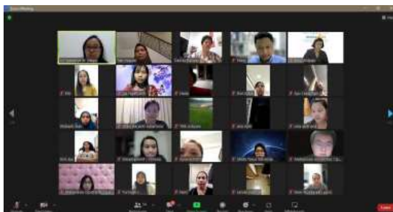
Gambar 1. Dokumentasi Sesi Pembukaan Acara

Acara dibuka oleh pihak Development Singapore yang dilanjutkan oleh dosen Universitas Ciputra untuk menjelaskan tujuan diadakannya PKM ini dan alur kegiatan dari awal hingga akhir. Selain itu, pada pembukaan acara ini juga diperkenalkan pihak Universitas Ciputra yang hadir, yakni dua dosen yang berperan sebagai pemapar materi manajemen logistik, serta enam mahasiswa yang mendampingi dosen selama kegiatan PKM berjalan. Terdapat sekitar 70 partisipan yang bergabung dalam Zoom dan mengikuti pemaparan materi dari awal pertemuan hingga akhir.