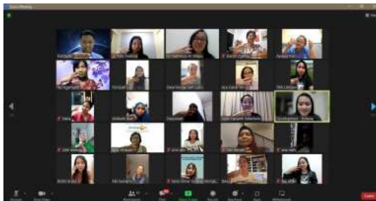
Gambar 5. Dokumentasi Sesi Presentasi Refleksi & Penutupan