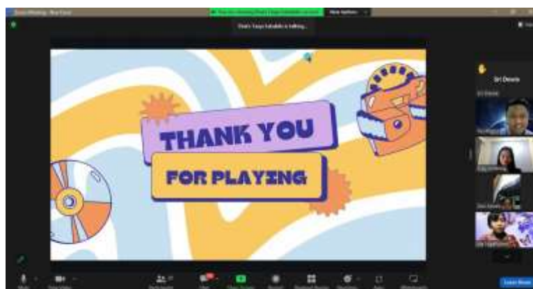
Gambar 4. Dokumentasi Sesi Ice Breaking

Setelah pemaparan materi dilakukan, dua mahasiswa kemudian memandu partisipan untuk melaksanakan permainan ice breaking yang berjalan kurang lebih selama 45 menit. Sesi ini bertujuan untuk menghilangkan kejenuhan dan mencairkan suasana melalui berbagai permainan yang telah disiapkan, yakni berhitung cepat harga suatu barang dan tebak tokoh entrepreneur terkenal. Setelah waktu yang diberikan habis, seluruh partisipan dihimbau untuk bergabung kembali ke main room untuk melanjutkan sesi selanjutnya.