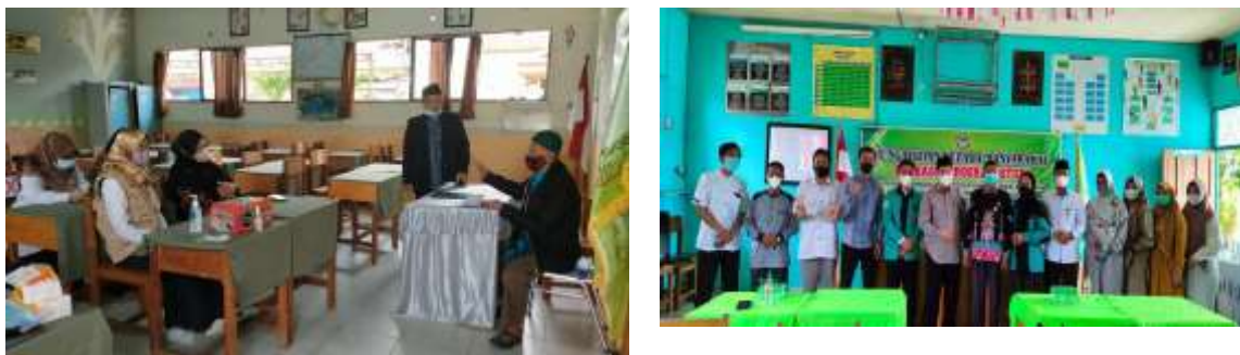
Gambar 5. Tim Pengabdian sedang melakukan tindak lanjut

Tata Kelola administrasi dalam sebuah Lembaga khususnya sekolah sangat penting, hal ini sesuai dengan hasil penelitian oleh Fatchun Hasyim, dkk yang menyimpulkan bahwa kegiatan pengabdian pada masyarakat pendampingan pengelolaan administrasi meliputi 1) Pelatihan penanganan arsip dinamis manual dan secara elektronik. 2) Pendampingan pengadaan komputer laptop. 3) Pendampingan kegiatan alih media dan penyimpanan dokumen secara elektronik. Adapun hasil kegiatan pengabdian pada masyarakat ini meliputi (1) Menyadarkan pentingnya pengelolaan arsip secara terpusat di sekolah dan pentingnya mengelola data pokok kependidikan serta dokumen hasil kegiatan secara elektronik. (2) Tersedianya sarana dan peralatan kearsipan serta pengimputan data siswa dan (3) Tersedianya dokumen elektronik (Hasyim et al., 2020).