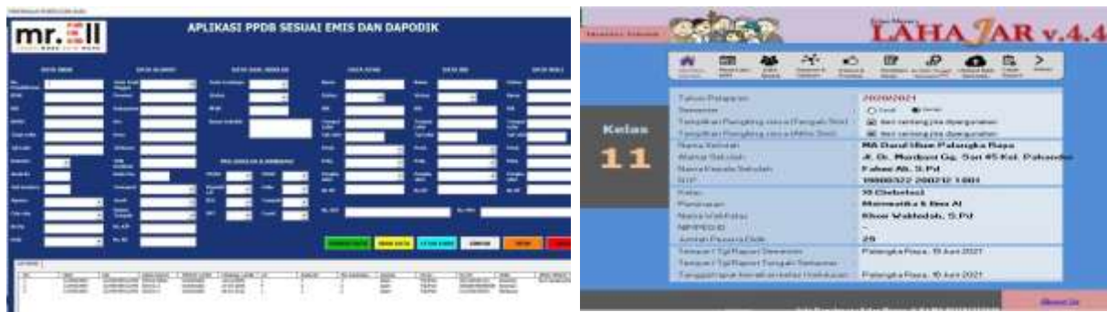
Gambar 4. Produk Aplikasi Pengabdian