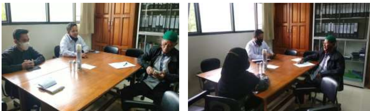
Gambar 2. Tim sedang Melakukan identifikasi dan perencanaan program pengabdian