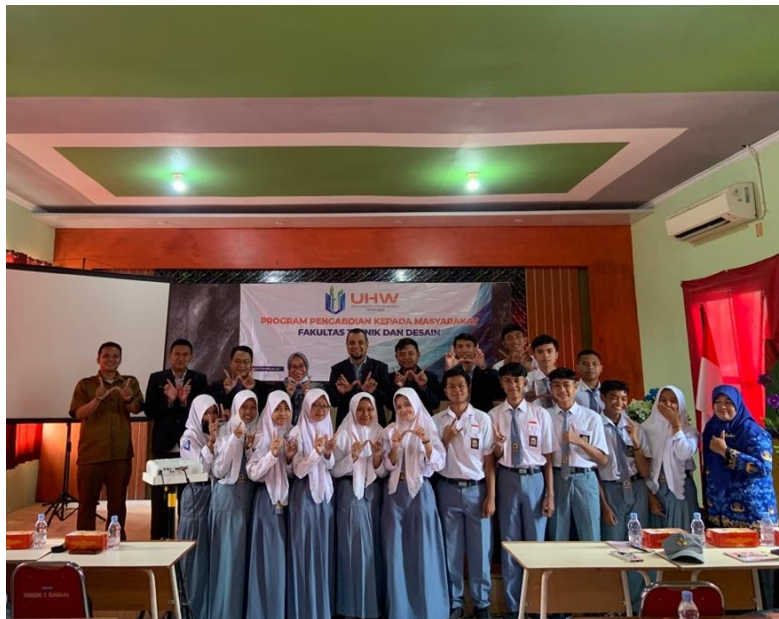
Gambar 3. Peserta pelatihan SMKN 1 Kamal

pelajari. Foto ini juga menunjukkan kerja sama yang baik antara peserta dan pengajar, serta mencerminkan suksesnya acara dalam menciptakan pengalaman belajar yang positif dan produktif.