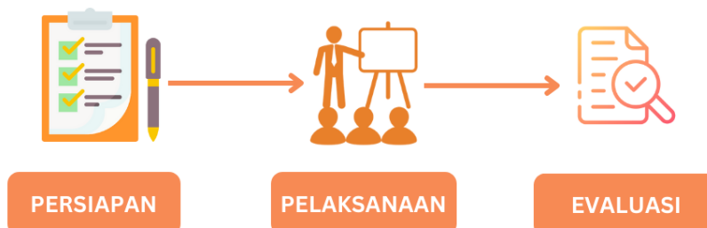
Gambar 1. Metode Pelaksanaan

Kegiatan ini diikuti oleh tim pengabdian UHW Perbanas bersama SMKN 1 Kamal, mulai dari kepala sekolah, guru, dan siswa. Langkah-langkah kegiatan ini mencakup persiapan, pelaksanaan dan evaluasi seperti yang ditunjukkan pada Gambar 1.