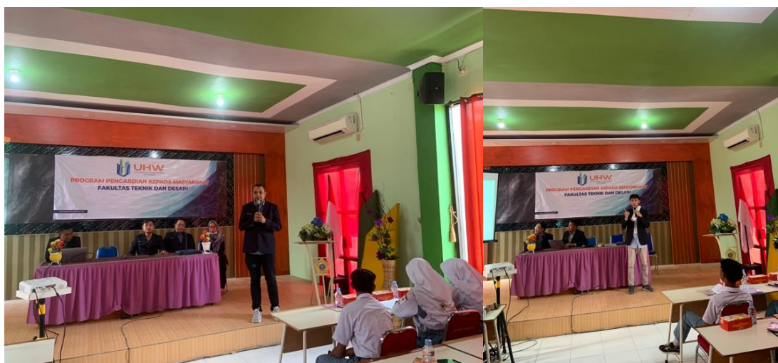
Gambar 2. Kegiatan pelatihan Curriculum Vitae (CV)

Pelaksanaan pengabdian masyarakat terdiri dari dua tahap, yaitu pelatihan yang disampaikan oleh narasumber kepada peserta dan melakukan evaluasi kegiatan. Pelaksanaan pelatihan diawali dengan sambutan dari pihak sekolah dan tim pengabdian. Kemudian dilanjutkan dengan penyampaian materi oleh tim pengabdian. Materi diawali tentang pengenalan strategi digital marketing dan dilanjutkan dengan pelatihan landing page . Materi disajikan dalam modul digital tentang konten-konten pada Curriculum Vitae (CV) yang dilanjutkan dengan pembuatan landing page dengan Google Site. Dalam kegiatan ini peserta juga melakukan praktik secara langsung pada perangkat masing-masing. Kegiatan pelatihan ditunjukkan seperti dalam Gambar 2, dimana narasumber memberikan instruksi kepada peserta pelatihan.