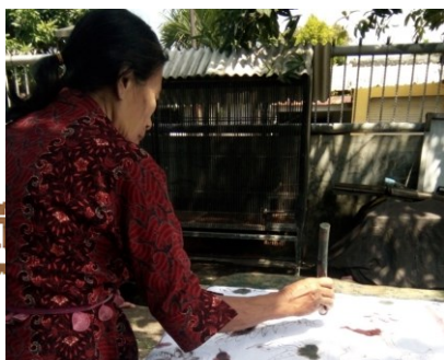
Gambar 2 Proses pewarnaan batik (03 desember 2017)

Nilai estetika di dalam seni batik terdapat dalam struktur pembentuk karya seni batik, yaitu motif batik dan warna batik. Selain itu, batik juga memiliki makna yang terbentuk dari simbol-simbol yang kompleks yang berfungsi sebagai perwujudan visual dari suatu kepercayaan, norma-norma, etika, serta pandangan hidup masyarakat, jadi batik merupakan ungkapan dari suatu budaya masyarakat itu sendiri di setiap daerah memiliki tatanan hidup dan aturan sendiri dan menjadikan budaya dan hasil budaya itu berbeda antara daerah satu dengan yang lainnya.