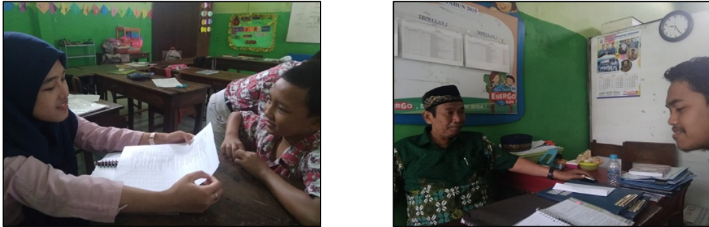
Gambar 2. Wawancara dengan guru dan siswa

Berdasarkan gambar diatas, skor terbesar yang diperoleh adalah 3,75 pada variabel ke 3 yaitu Penguatan sikap kreatif. Hasil tersebut diperoleh karena pada kuisioner hanya ada 1 pertanyaan yang membahas variable tersebut. Skor terendah yang diperoleh adalah 2,8 pada variable ke 7 yaitu sikap jujur. Hasil tersebut diperoleh karena memang sikap jujur ini bukan menjadi salah satu fokus dari kuisioner. Namun variable sikap jujur ini di fokuskan pada wawancara. Wawancara dilakukan kepada guru dan siswa di tingkat Sekolah Dasar di kota Semarang