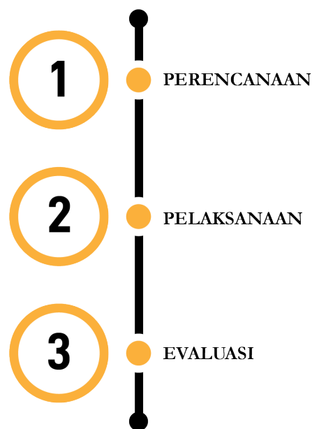
Gambar 1. Bagan Alur Pelaksanaan

Pada kegiatan pengabdian masyarakat ini, dikelompokkan menjadi tiga tahapan pelaksanaan utama yaitu persiapan, pelaksanaan, dan evaluasi. Secara sistematis tahapan program pengabdian masyarakat dapat digambarkan melalui bagan sebagai berikut :