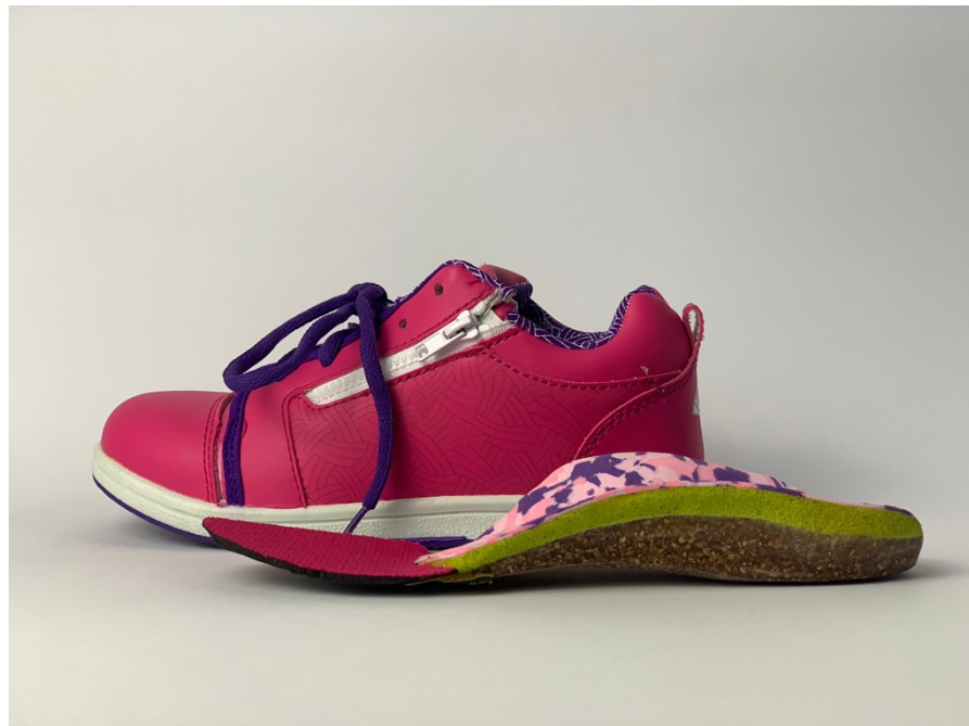
Gambar 3. Produk sepatu