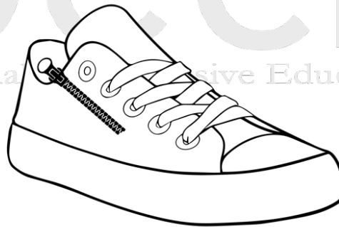
Gambar 2. Desain sepatu