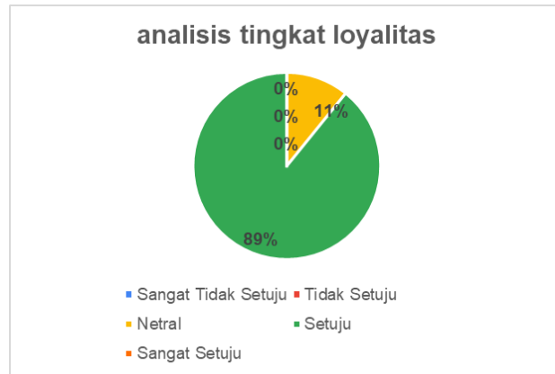
Gambar 1. Persentase Tingkat Loyalitas Atlet

Berdasarkan analisis statistik deskriptif diperoleh nilai rata-rata (mean) sebesar 35,35 dengan standar deviasi sebesar 3,02. Nilai tersebut menunjukkan bahwa tingkat loyalitas atlet berada pada kategori tinggi. Hal ini mengindikasikan bahwa atlet memiliki komitmen yang cukup kuat untuk tetap bertahan, berpartisipasi, dan berkontribusi dalam kegiatan klub. Berdasarkan hasil pengolahan data, tingkat kepercayaan atlet diklasifikasikan ke dalam beberapa kategori, yaitu sangat tidak setuju, tidak setuju, netral, setuju, dan sangat setuju. Hasil penelitian menunjukkan bahwa sebanyak 89% responden berada pada kategori setuju dan 11% berada pada kategori sangat setuju. Hal ini menunjukkan bahwa seluruh responden memiliki tingkat kepercayaan yang positif terhadap klub, serta tidak terdapat responden yang berada pada kategori negatif.