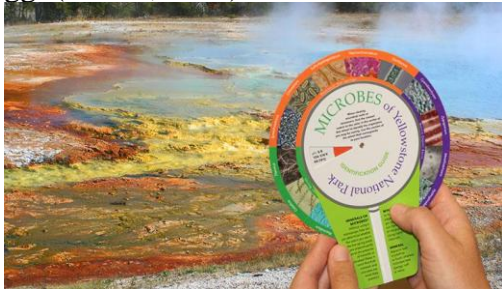
Gambar 1. Ekosistem Thermus aquaticus di sumber air panas Yellowstone National Park.

alaminya memiliki suhu berkisar antara 50-80°C, dengan suhu optimal pertumbuhan sekitar 70-75°C 2 . Kondisi lingkungan ini umumnya memiliki pH netral hingga sedikit basa (pH 6-8) serta kandungan mineral yang tinggi (Dustin, 2005).