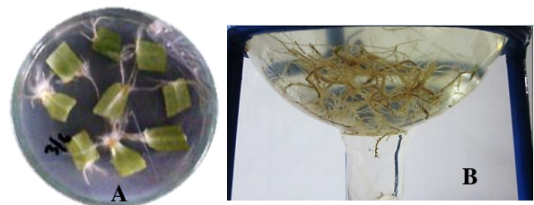
Gambar 1. Akar rambut tanaman ginseng Jawa hasil transformasi dengan Agrobacterium. rhizogenes LB 510. (A). Inisiasi akar rambut dari tepian eksplan; (B). Kultivasi akar rambut di medium MS cair bebas hormone dalam BTBB; (C). Akar rambut hasil kultivasi di BTBB selama 28 hari kultur.

Keberhasilan transformasi ditandai dengan munculnya akar rambut pada bagian tepi eksplan (Gambar 1A). Sebanyak 2 g akar rambut dikultivasi pada medium MS cair bebas hormon selama 28 hari (Gambar 1B). Pada akhir kultivasi, akar rambut dipanen dan dikering-anginkan (Gambar 1C).