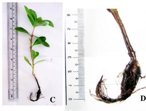
Gambar 2. Tanaman ginseng Jawa berumur 3 bulan (A) dan akar (B). Tanaman ginseng Jawa berumur 6 bulan (C) dan umbi dan akar (D).